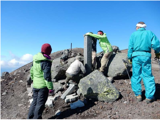
「壺万人講社」設置の石柱傾きを修正(「一升目」)