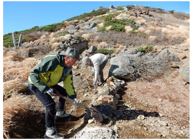
鬼ヶ城分岐付近