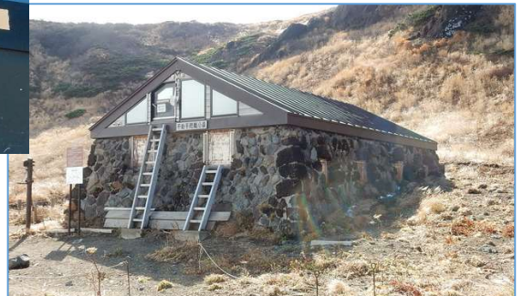
冬季対策を終えた不動平避難小屋