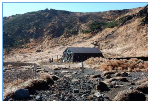
不動平避難小屋周辺