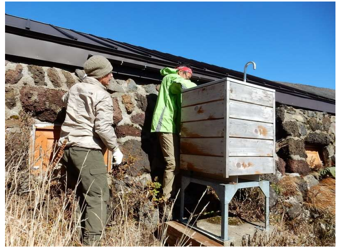
雨水集水設備の冬季対策(雨樋撤収、注水口閉鎖)