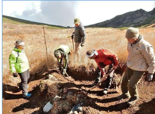
不動平避難小屋前への流れ込みを防止するため、水切り設置と補修作業を実施