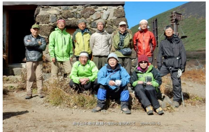
不動平避難小屋前にて記念撮影