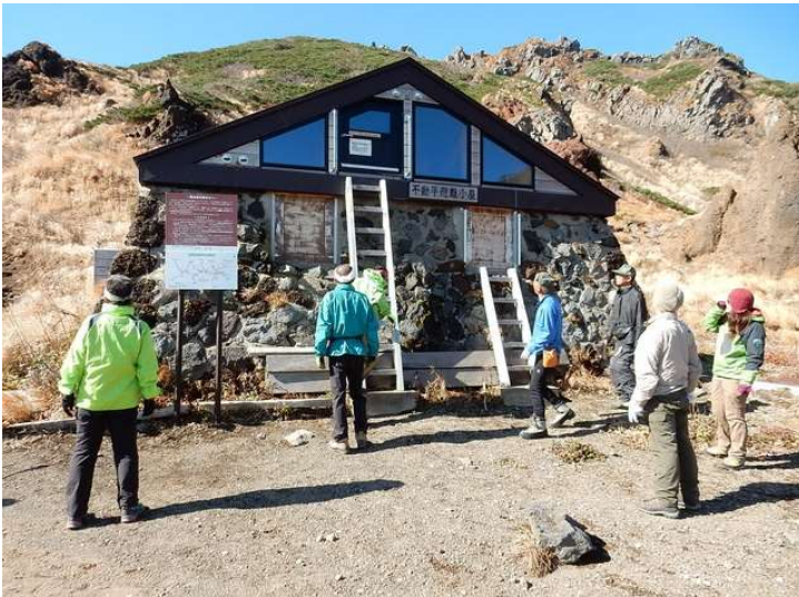
北側窓覆い設置状況