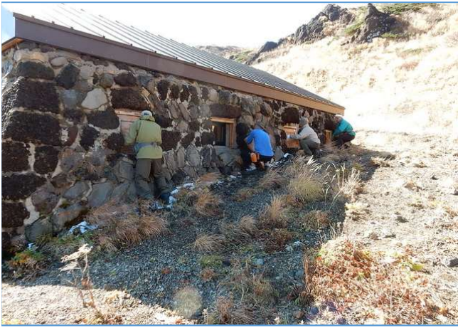
西側窓覆い設置、雪氷張り付きが無く迅速に設置できた