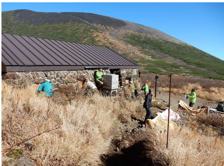
窓覆いの設置と毛布天日干し