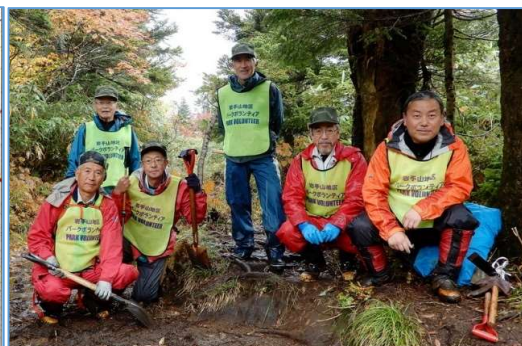
水切りNo. 1にて 作業参加者