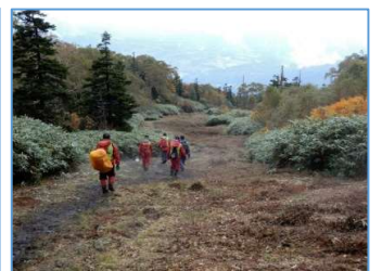
下山時はリフト動かさず歩く