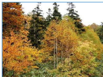
リフト脇の紅葉鮮やか