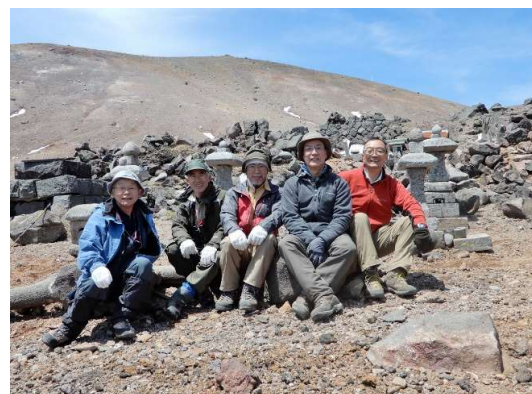
組立復元作業を終えて