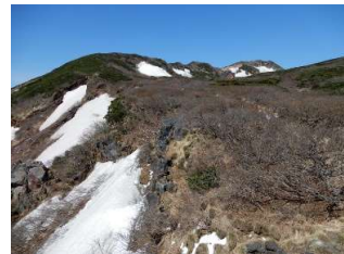
7合目上から不動平方向