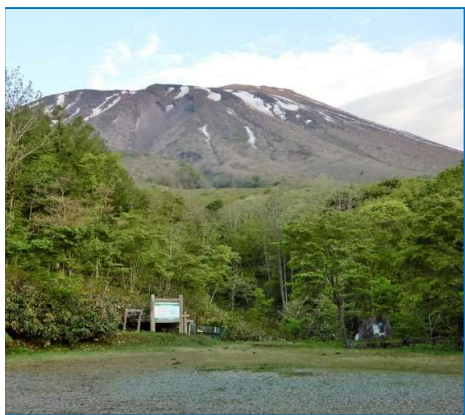
残雪も残り少ない