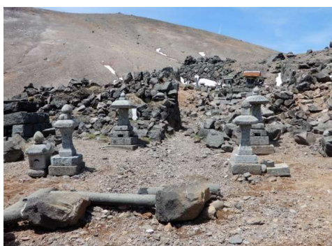
(上) 倒壊状況 (下) 組立後の石灯笼