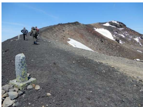
お鉢の三十三観音石像は全て立てられていた