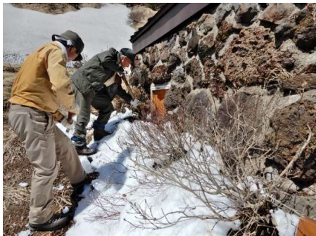
東側窓付近には2日前の新雪が残る