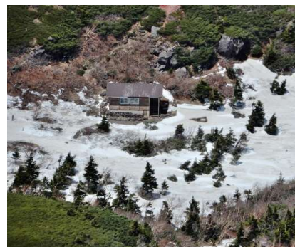
山頂から平笠不動小屋俯瞰