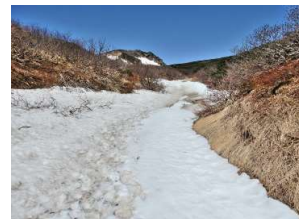
八合目上の残雪区間