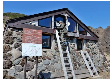
冬季出入口扉の開け放し防止ゴムバンド設置