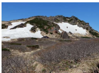
不動平小屋と鬼ヶ城