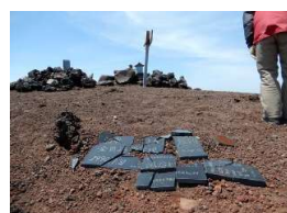
山頂に露出している 登頂記念の古い石版等