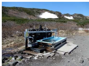
御成清水は十分に湧出