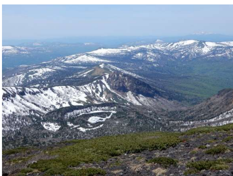
お苗代湖と裏岩手の連峰