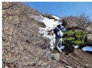
7合目直下の残雪上歩行