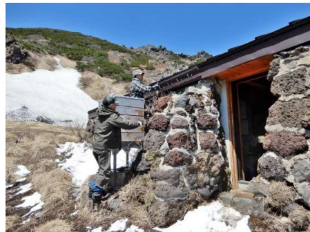
掃除用天溜集水雨樋セット