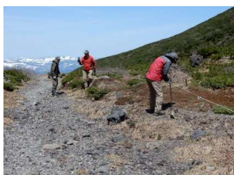
不動平 (お花畑へのルート)