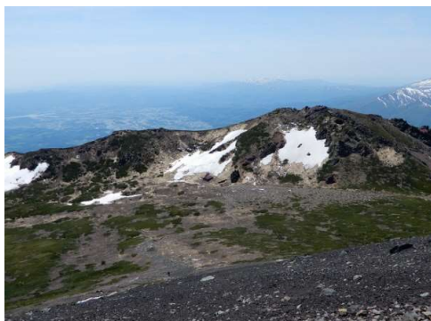
お鉢から不動平俯瞰