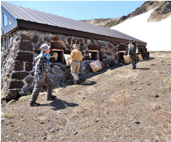
西側窓の覆戸外し・・・残雪消えて作業容易