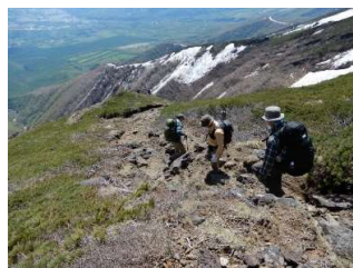
御神坂コースを下山