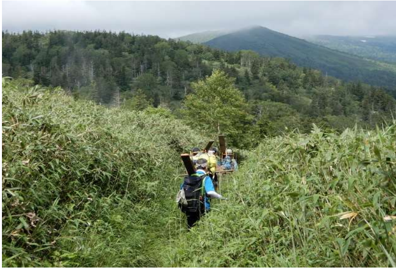
資器材を担いで作業箇所をめざす (正面は大松倉山)