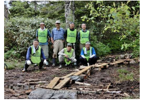
①地点の整備完了して