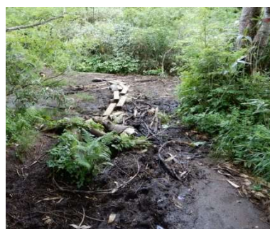
同左 (大松倉山側から)