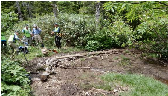
作業着手前現況 前年度設置の水切りが効果を発揮していた