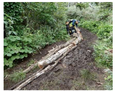
⑨地点 枯損木等敷設完了