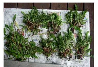
駆除したセイヨウタンポポ