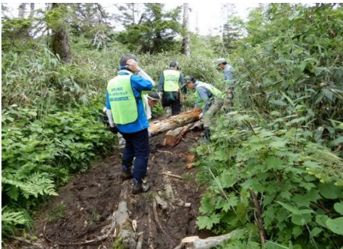
【⑨地点】木歩道（倒木・枯損木敷設）