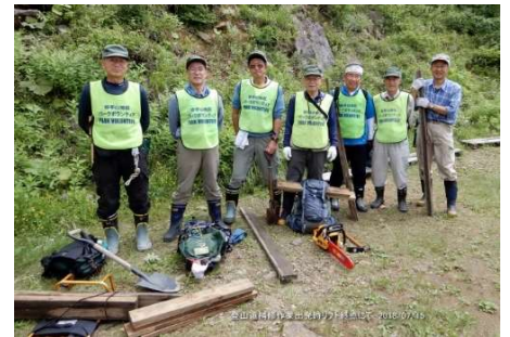
リフト終点にて 作業参加者