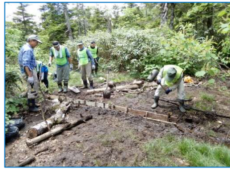
水切り側壁に古板材使用