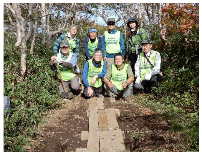
作業を終えて 参加者一同