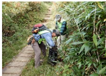
同左、土のうづくり