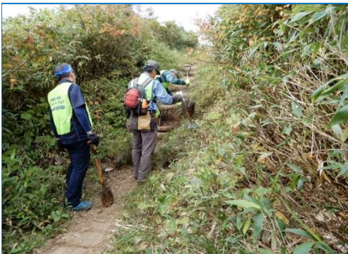
土のうと枯損木利用