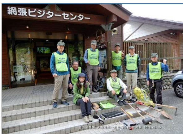
出発前に搬入用具類を並べて