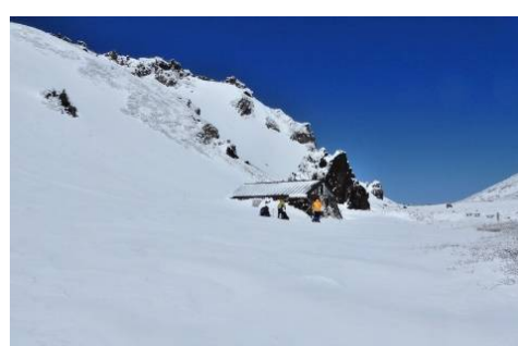
9合目不動平小屋付近