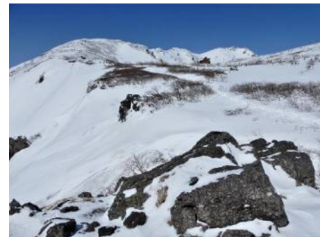
7合目上から八合目小屋方向