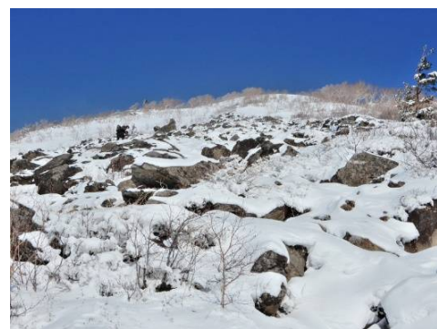
4.5合目付近から5合目方向