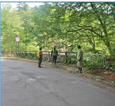
トンネル前付近(着手前)