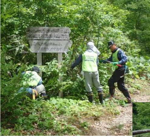
三ツ石山登山口付近