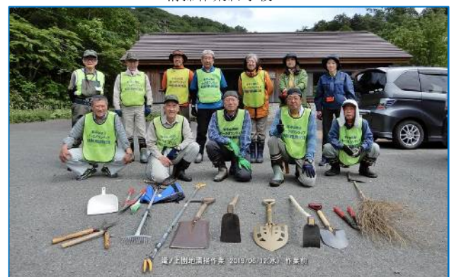
滝ノ上園地清掃作業 2019/06/12(水) 作業前