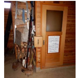
小屋内部異常無し