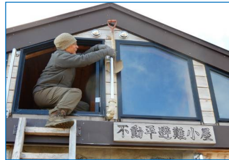
除雪用スコップ取付