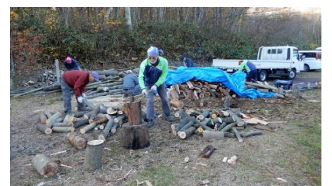
薪作り作業中の山岳会員 (馬返し口)