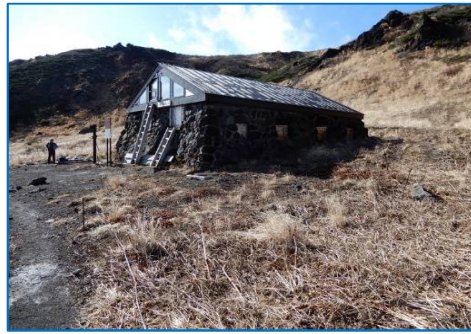
不動平避難小屋 外周は異常なし