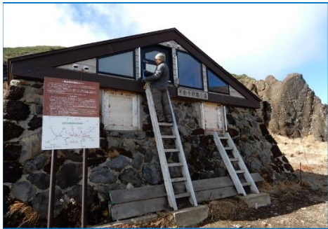
冬期出入口扉の締め忘れ防止