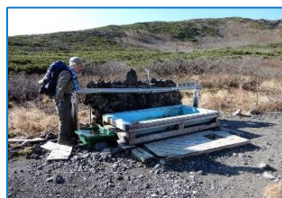
御成清水は止められた