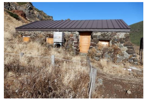
夏季出入口も閉鎖異常無し