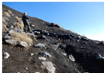
お鉢登坂路途中の水切り 流下痕跡無し (異常無し)