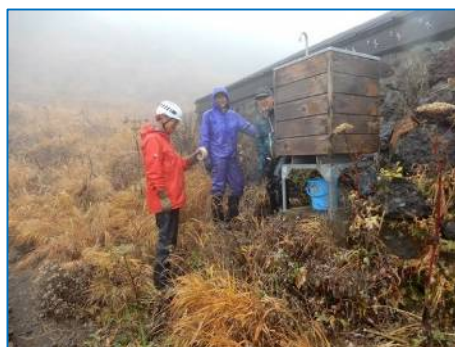
保管用水の確保