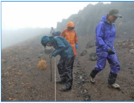
奥宮周辺 ロープ外し