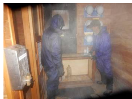
夏季出入口内側の閉鎖措置作業