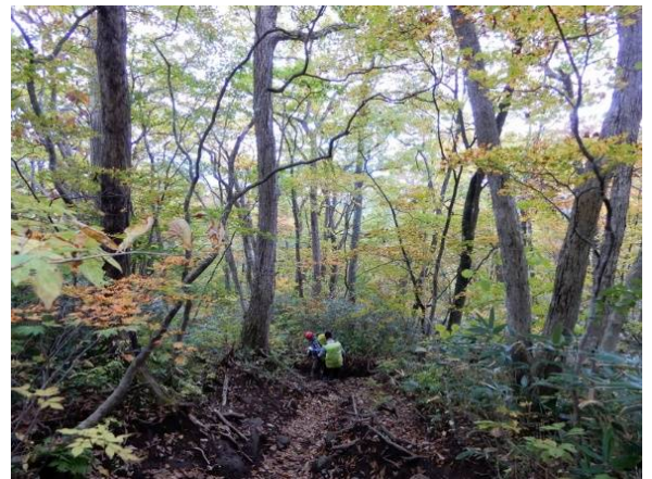
柳沢コース0.5合目上付近