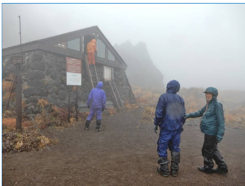
冬期出入口への除雪用スコップ取り付け