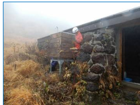
貯水タンクの水抜き