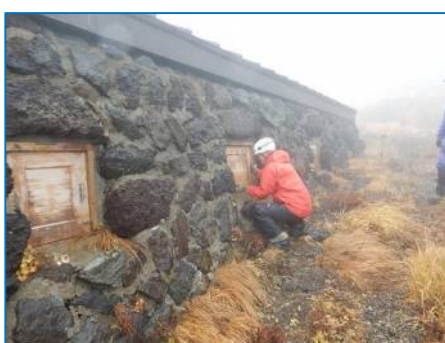
西側窓覆板取付 (撮影：家子)