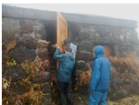
夏季出入口閉鎖作業 (覆板取付)