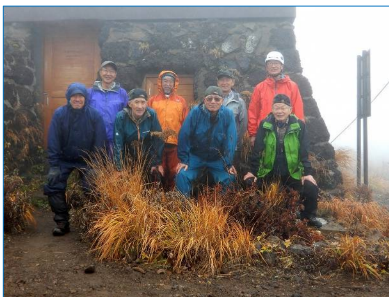
作業を終了して下山開始前に記念撮影 「お疲れさん！」