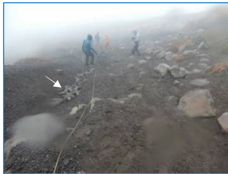
お鉢登坂路中間上部付近