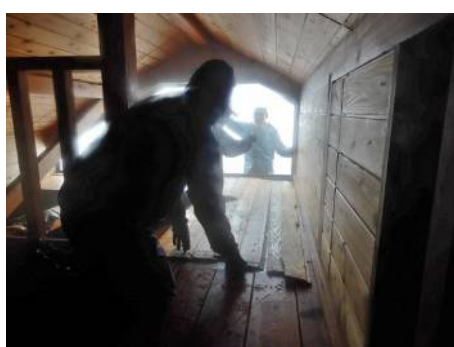
2階冬期出入口の内側 アイゼン爪対策用板材敷き並べ