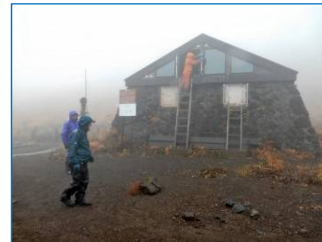
雪堀用スコップ取り付け