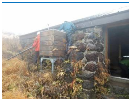
清掃用雨水集水設備撤収