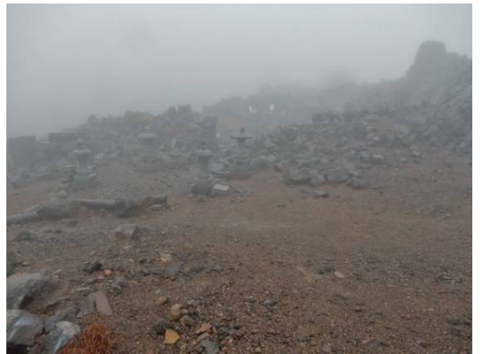
奥宮前の石灯籠は4基ともしっかりしていた