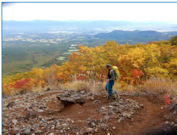
下山時には雲も消え、盛岡市街地も望みできた 柳沢コース2合目付近の紅葉