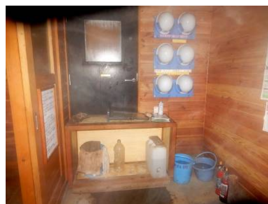
夏季出入口内側の開放防止対策 木製柵と掃除用水などを配置