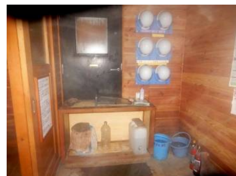
同左作業終了後 (木製棚と保管雨水)