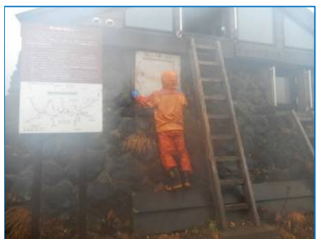
トイレ窓等覆板取付