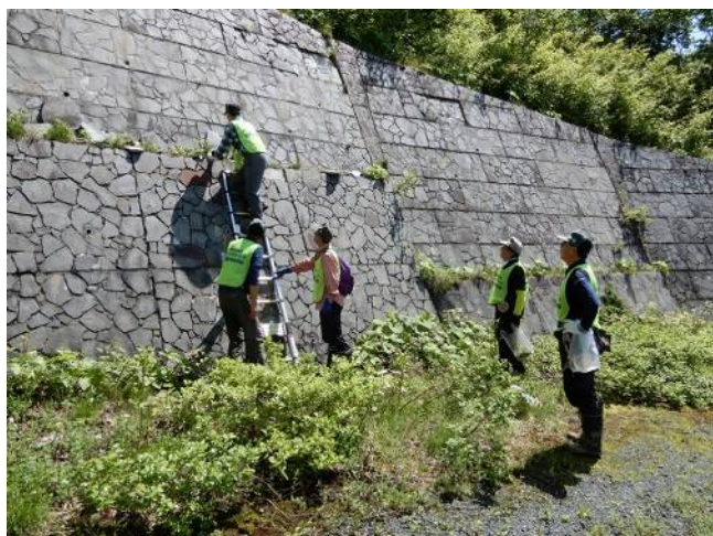
擁壁中段のセイヨウタンポポ駆除 (終点~展望地間) 活動助成金で購入した伸縮梯子が大活躍