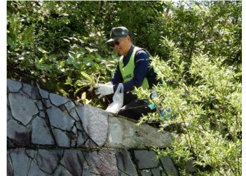
この場所は背丈程度の高さだから・・・