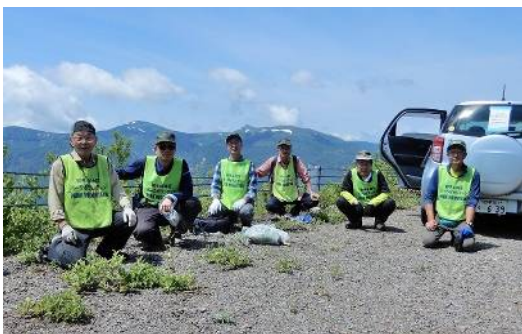
前半は好天に恵まれた。展望地で一息。