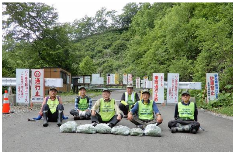
作業を終えて (駆除量は年々減少傾向。毎年実施の成果かも)