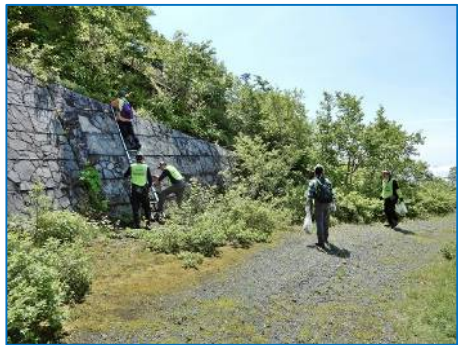
「高い擁壁の上には登ってはダメだよ！」 転落事故防止に細心の注意しながら