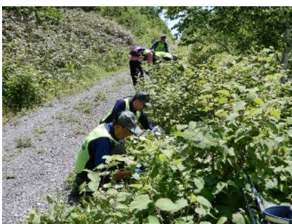
イタドリなどの下に沢山発見