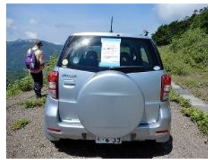
道路管理者の許可証を貼って (車両利用で効率大幅アップ)