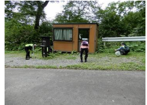
ゲート前広場のセイヨウタンポポ駆除