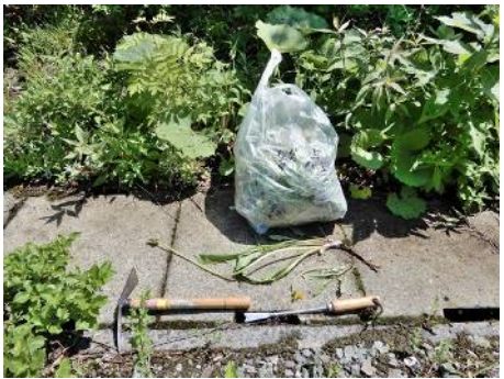
茎を長く伸ばし蕾を付けたセイヨウタンポポ