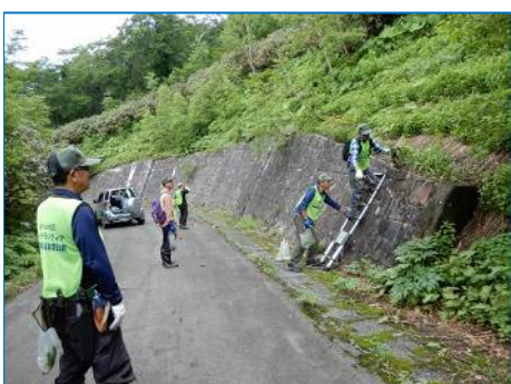
高い擁壁天端には登らず、梯子で作業。車両利用で梯子運搬が可能になった