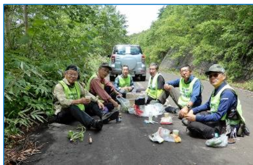
「コーヒータイム」リーダー提供に感謝しつつ