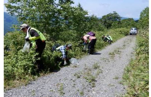
未舗装区間、この辺りはタンポポ密生