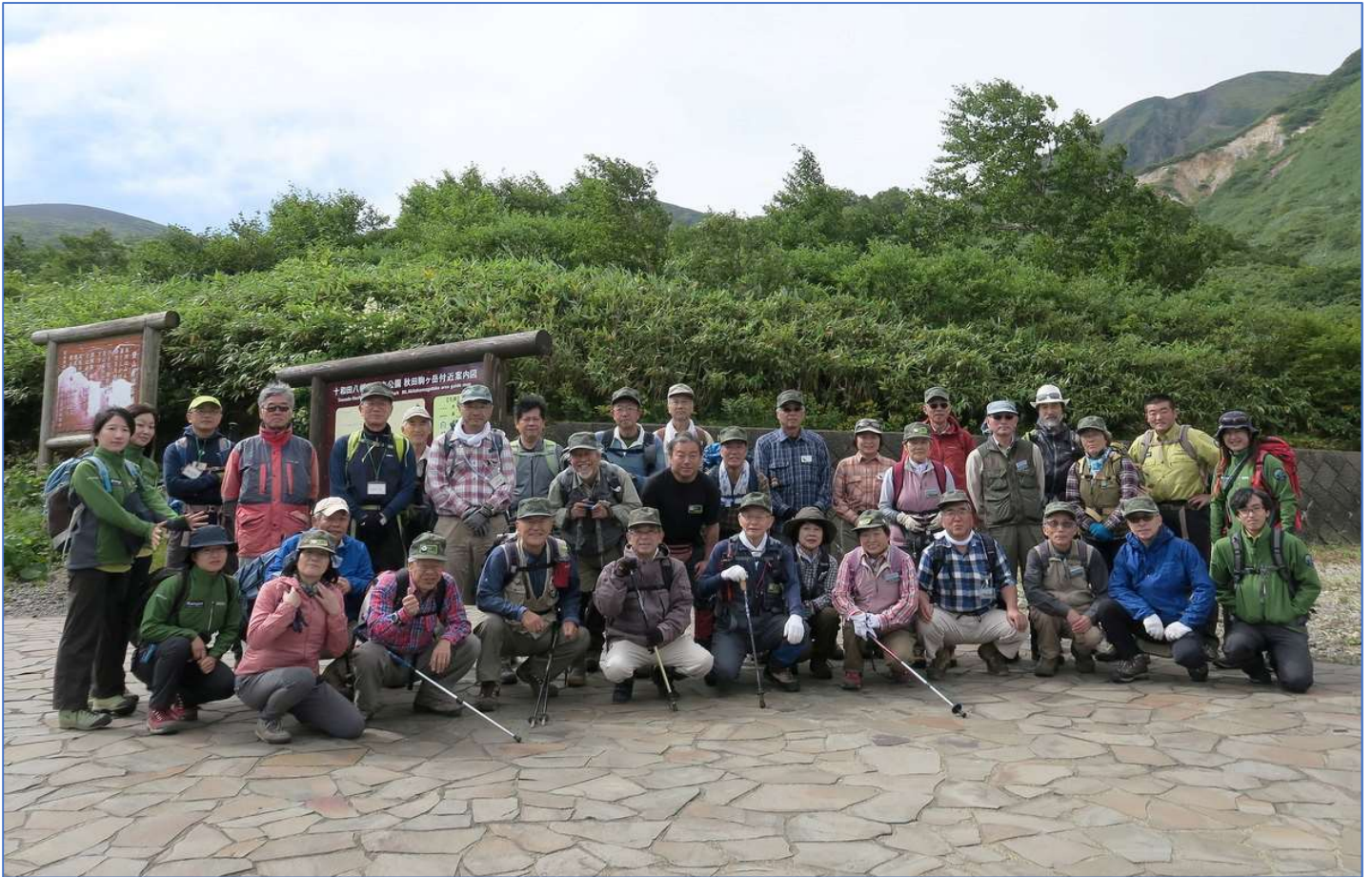
秋田駒ヶ岳自然観察会参加者