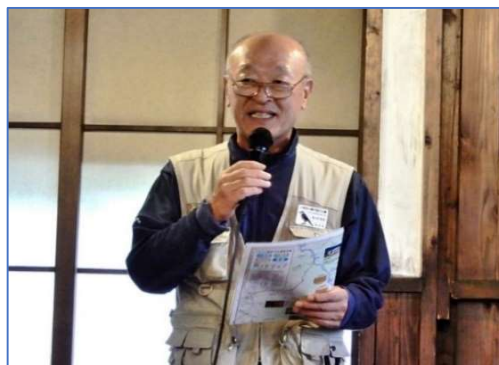
歓迎挨拶 ホシガラスの会