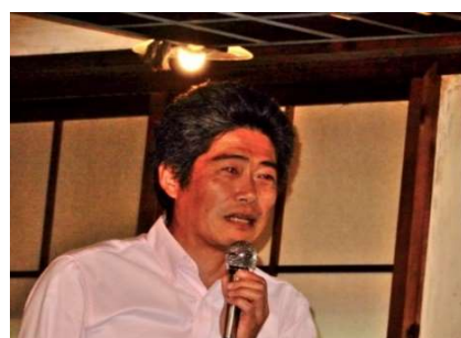
講演「秋田のクマと被害」