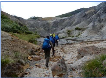
旧道は硫黄鉱山跡のルートに入る 地図には表示なし。急だが近い