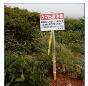
くま除けの鐘 単管パイプに鉄棒