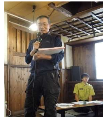
岩手山地区活動報告