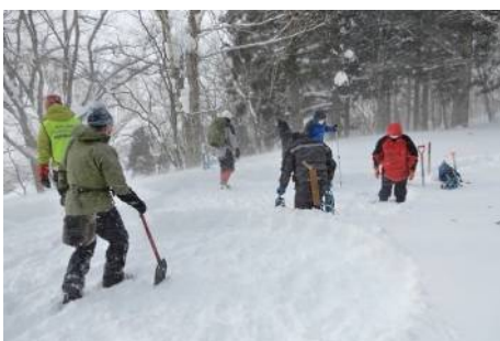
雪ブロック切り出し予定範囲と、イグルーを作る場所を全員で踏み固めた 踏み固め後、15分程度で雪がしっかり固結する