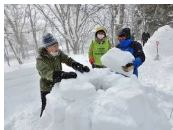
ブロック積みの終盤、天井部を絞るのに注意を要する