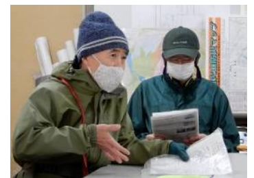
PV広野氏から作業要領等説明 手書きの略図を使用 (末尾に掲載)