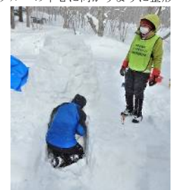
入口は最後に穴開け