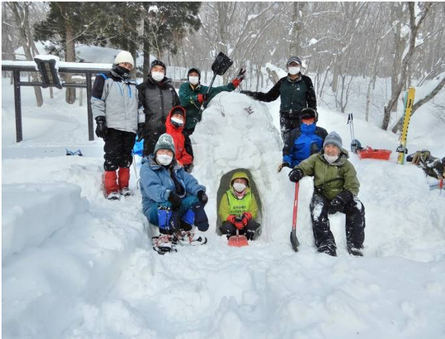
完成したイグルー前にて、参加者一同 (外に1名参加した)