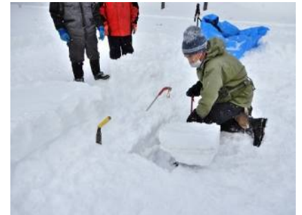
出来るだけ均一な形状が望ましいが、今回は雪質変化層で分離し易かった

〈イグルーづくり〉 内部に雪を詰めて支保工代わりにして積上げる方法と、ブロックだけで積上げる方法の二通りの方法で実施したが、今回はブロックだけで造る作業を記録した。