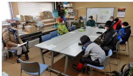
全員マスク装着、出来るだけ離れて着席