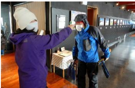
体温確認と、VC玄関で手の消毒を実施