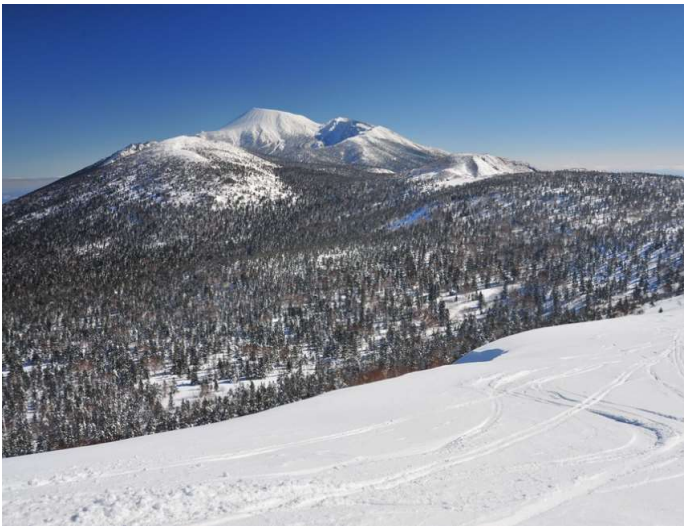
大松倉山中腹からの岩手山眺望