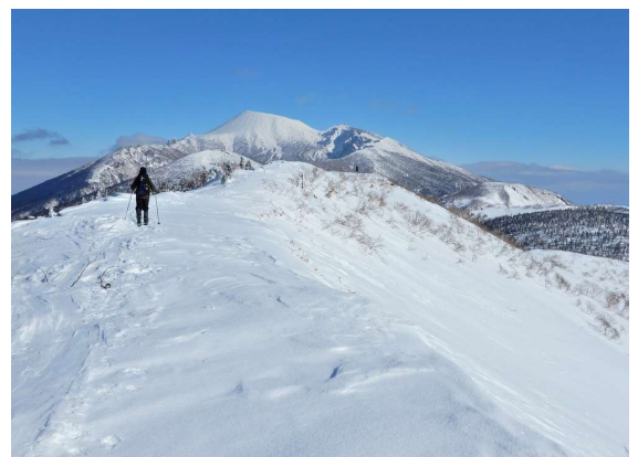
大松倉山頂上付近に行く (下山時)