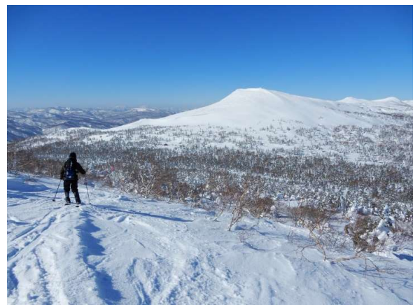
大松倉山稜線から三ツ石山荘への下降 三ツ石山荘が見えている