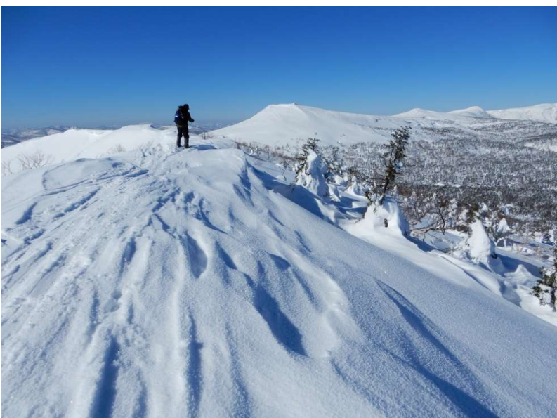
大松倉山頂上付近、正面に三ツ石山から小畚山など裏岩手の峰々

網張スキー場リフトはスキー装着者以外は利用できない。シール装着状態のスキーも安全上拒否されるので要注意。