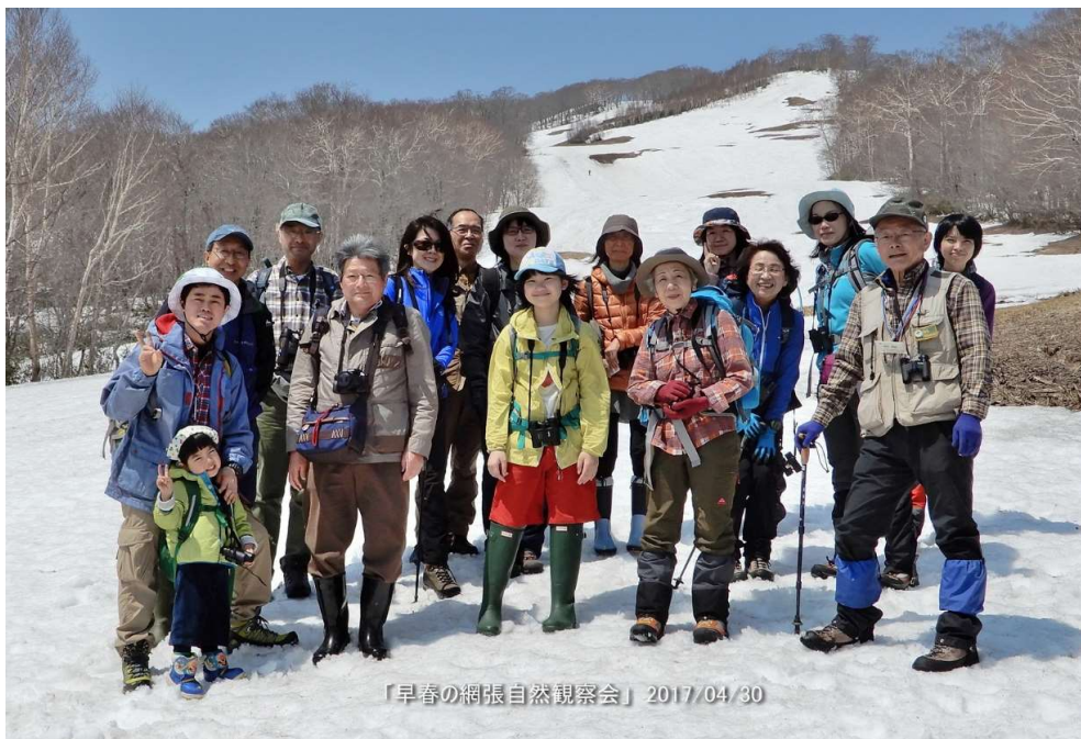
「早春の網張自然観察会」 2017/04/30