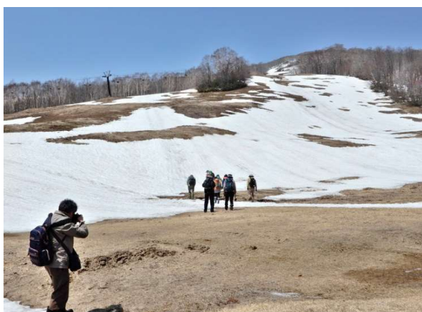
残雪が消え始めたスキーゲレンデを登る