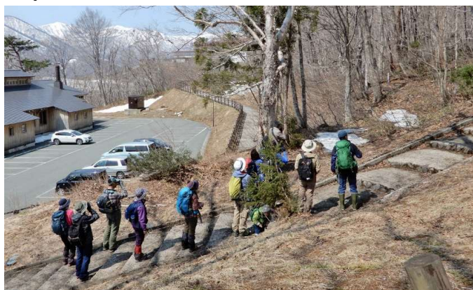
野鳥たちの囀りに耳を澄ます