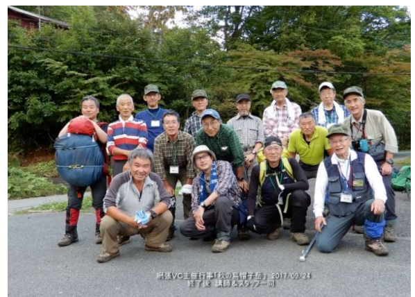
講師&スタッフ一同 「お疲れさん！」