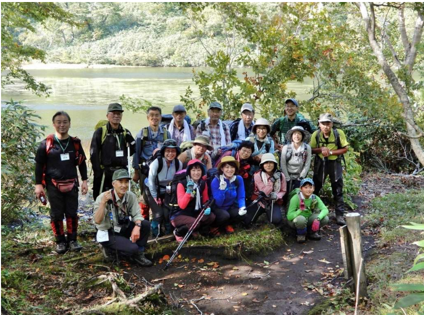
白沼畔にて記念撮影 2班 白沼の静寂な佇まいと爽やかな空気に急坂での疲れも吹き飛ば