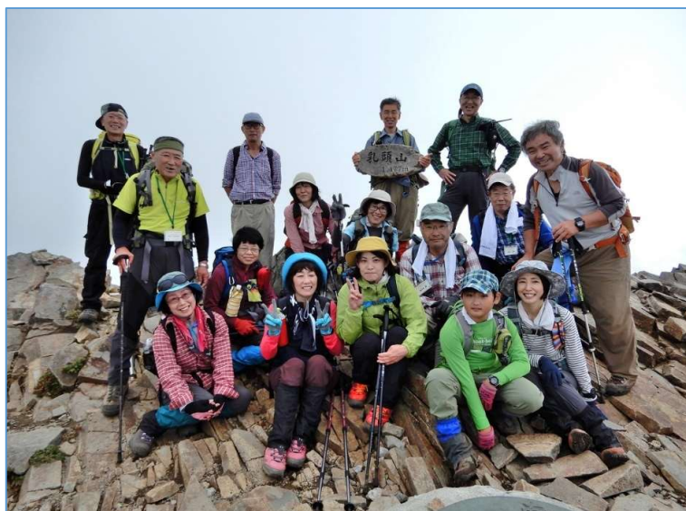
乳頭山頂上にて 2班