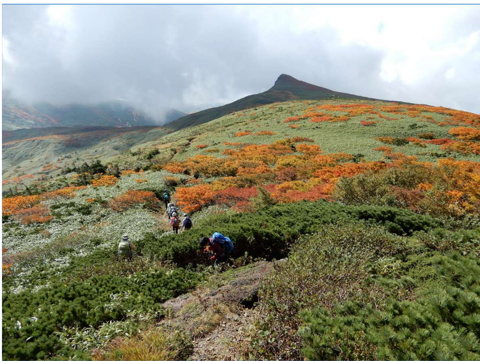
ハイマツやチシマザサの尾根を飾る紅葉を眺めながら乳頭山に向かう