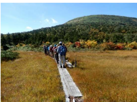
マムシ坂上の湿原、草紅葉が美しい