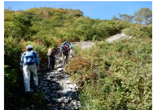
通称マムシ坂の下部を登る