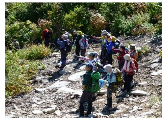
同上にて裏岩手の山並みを眺める