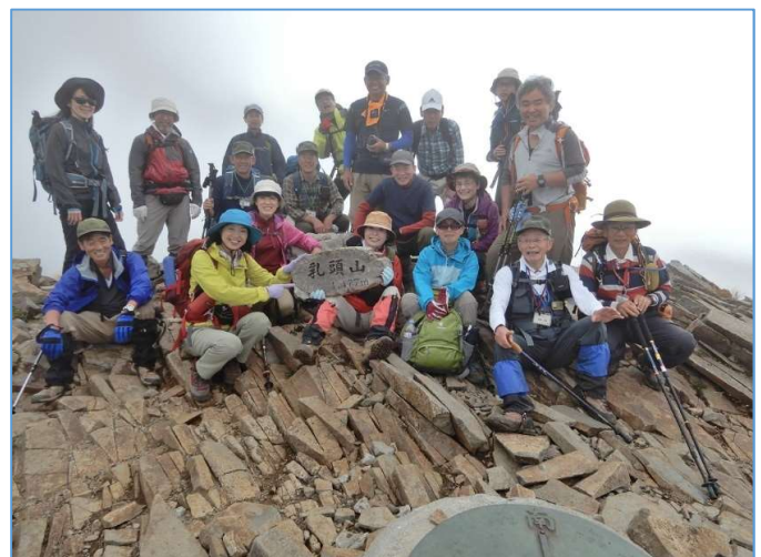
乳頭山頂上にて 1班