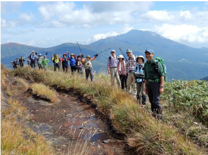
1428m峰（通称「小乳頭」）南東付近にて