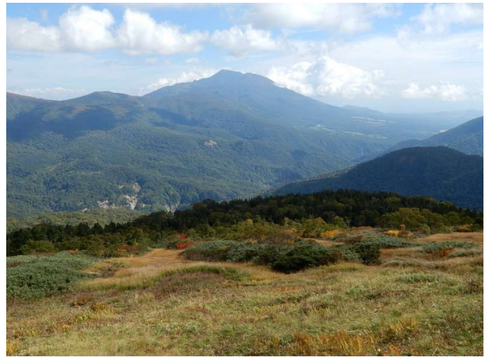
背後には雄大な岩手山が・・・