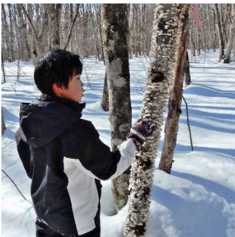
「これ、なんだ？」 スエヒロタケ