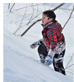
雪ダルマ なんのその