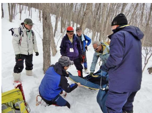
携帯トイレ用テント撤収