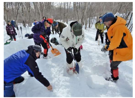
スノーソウと雪スコップの出番