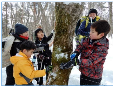
ノキシノブの観察