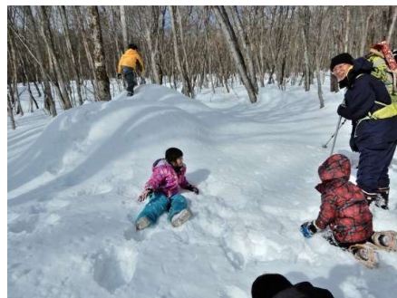
とにかく、雪に親しむ？