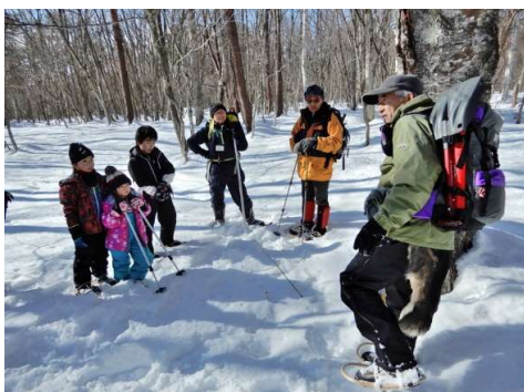
ダケカンバの幹割れ、 どうしてできるのかな？