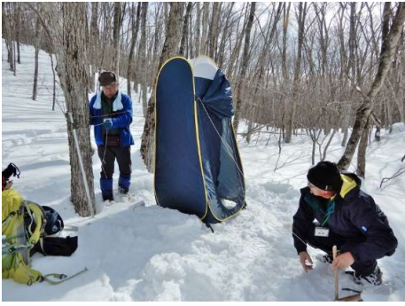
携帯トイレ用テント設営