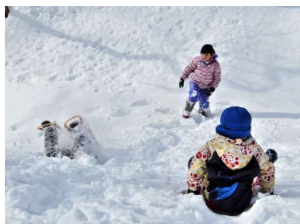
↑ ワッ！ 大丈夫？