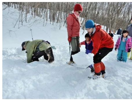
雪のテーブルとベンチをつくる