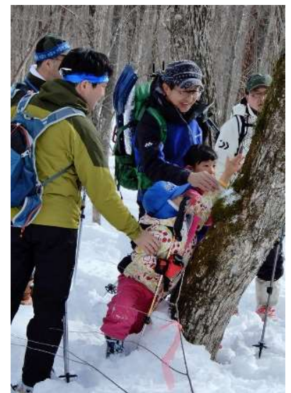
手が届いた！ノキシノブ