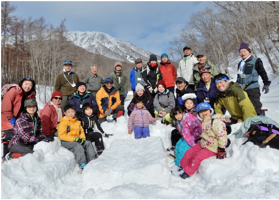
目標地点の熊沢治山ダム付近で岩手山を背景に、ハイ、ポーズ！

【参加者総数】 25名 一般参加者 11名 VC職員ほか 3名 パークボランティア 11名