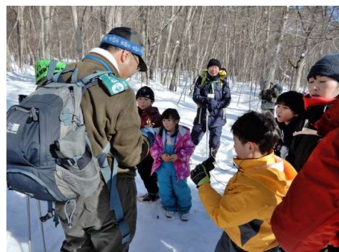
イワガラミの花（ドライフラワー）をみる