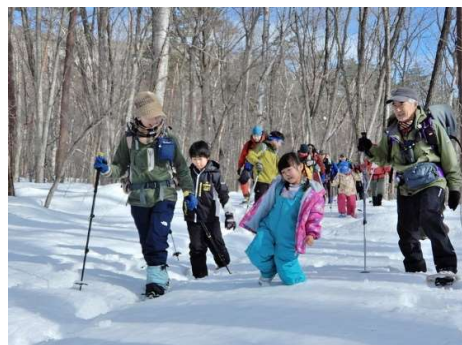
ツボ脚でも歩けるよ！