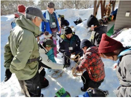
わかんじきの装着練習