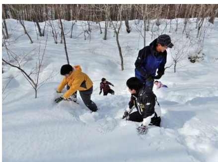
沢岸斜面で雪遊び