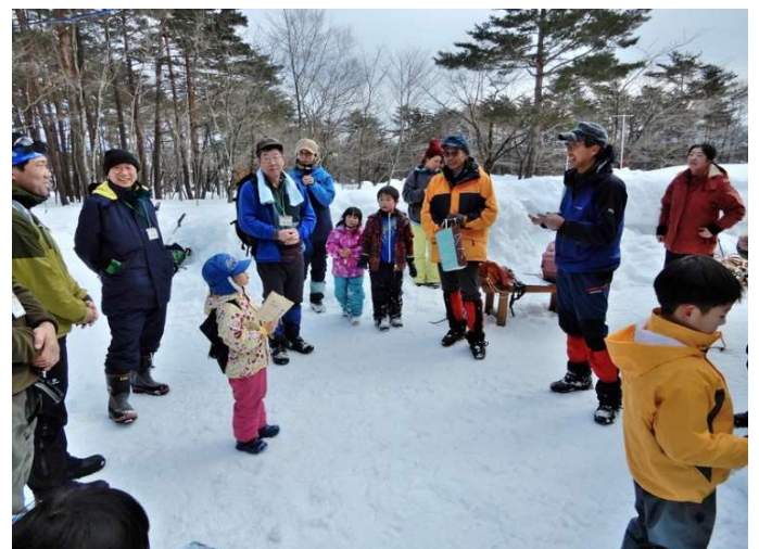
閉会式 ↑ 「タノシ Катタ」