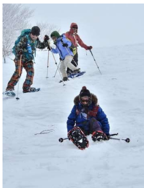
童心に還って尻滑り 何十年ぶりかな？ 樹林帯急斜面でも 尻滑りが人気だった