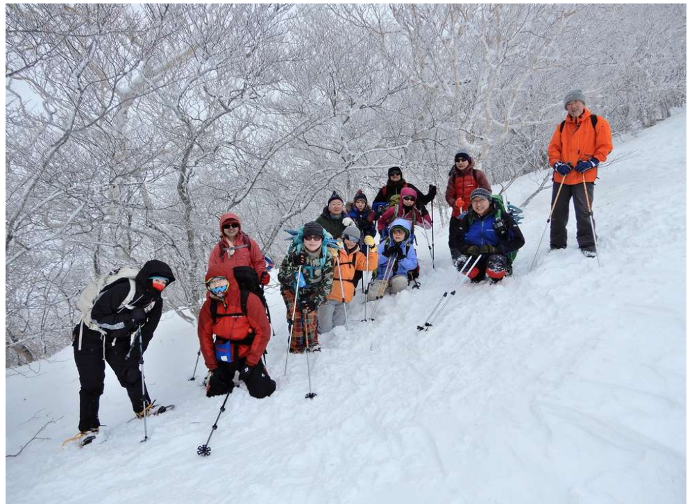
標高約1260m付近、下山時の2班