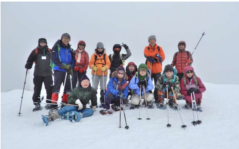
鎌倉森頂上にて 2班