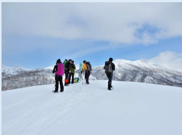
下見時（2/28）の鎌倉森頂上