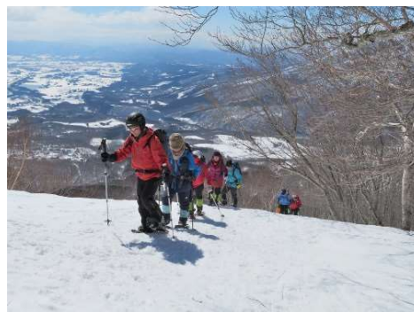
三浦PVの先導で登る2班