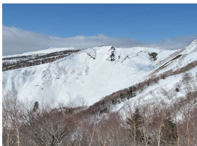
鎌倉森頂上から望む犬倉展望台下の全層雪崩跡