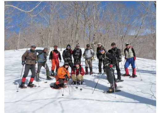
1班全員での記念撮影。ここから1名下山