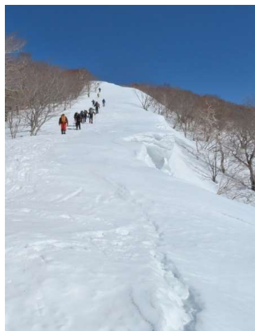
標高1,210m付近から山頂方向大きく張り出した雪庇の肩にクラックがはっきり出ている