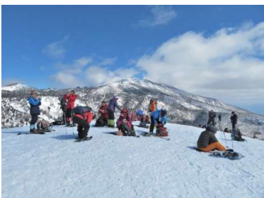
山頂で眺望を楽しみながら昼食休憩