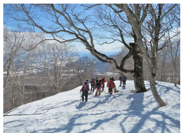
下山時、ひと息入れる (標高約1,000m地点)