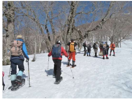
標高約1,000m 休憩ポイント