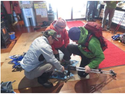
スノーシューの装着調整手伝い