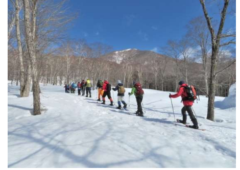
「エー！あそこまで登るの？」