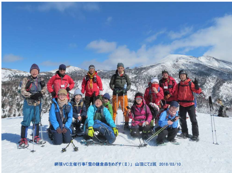
網張VC主催行事「雪の鎌倉森をめざす(Ⅱ)」 山頂にて2班 2018/03/10