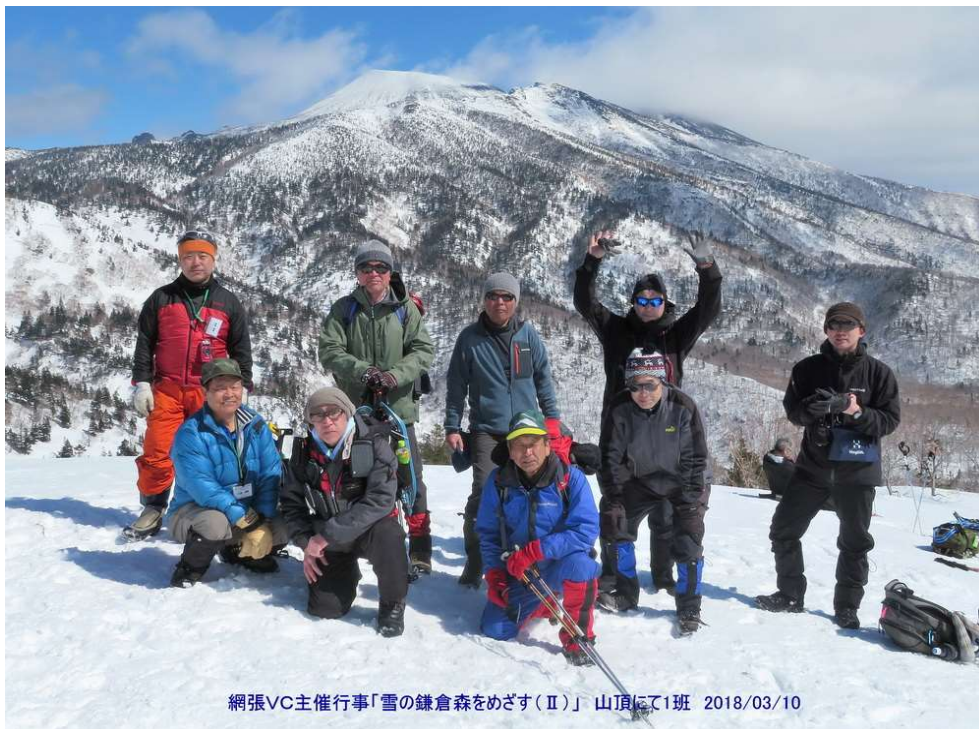
網張VC主催行事「雪の鎌倉森をめざす(Ⅱ)」 山頂にて1班 2018/03/10