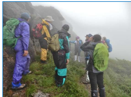
濃霧三ツ石山頂での火山教室