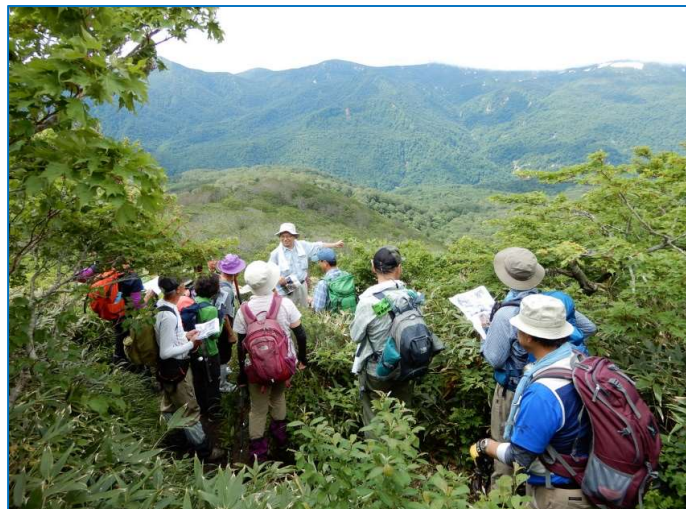
葛根田展望台（仮称）で葛根田地熱発電等の説明