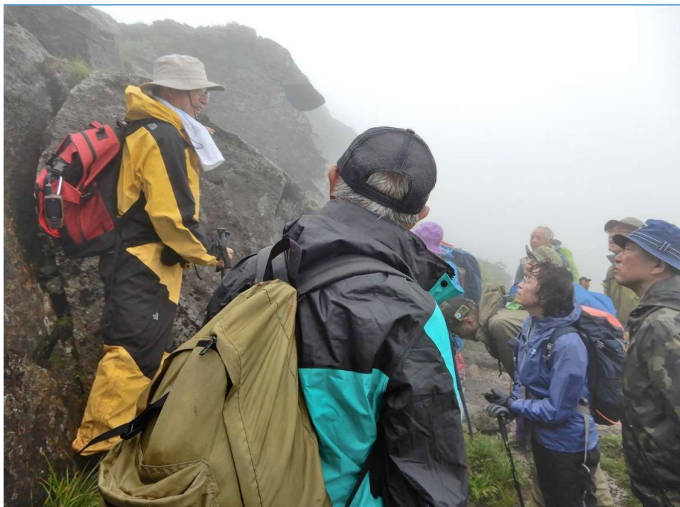
三ツ石山頂上付近での解説：山頂の岩は熔岩で山頂は噴火口跡とのこと