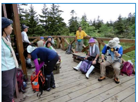
三ツ石山荘で小休憩