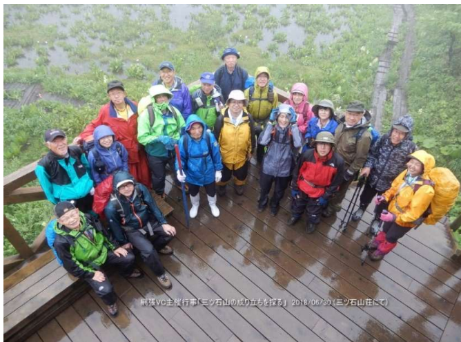
下山開始直前、雨の山荘デッキで