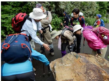
道路に落下した大石の観察