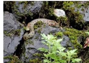
奥産道石垣にヤマカガシ