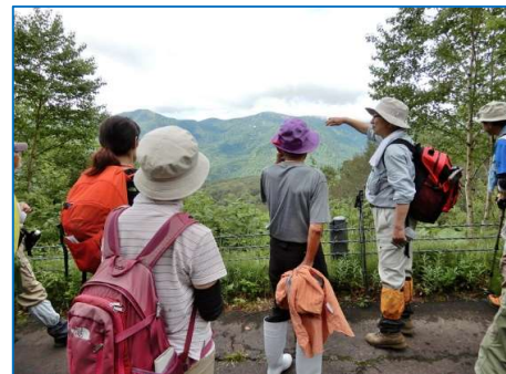
連絡道取付手前での説明状況