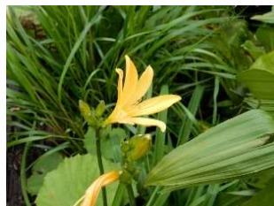
ニッコウキスゲも開花