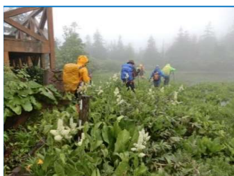
霧の三ツ石湿原を後に