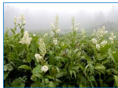
コバイケイソウ開花最盛期