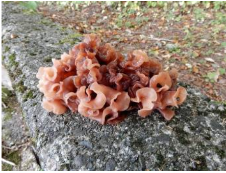
ハナビラニカワタケ (食可)