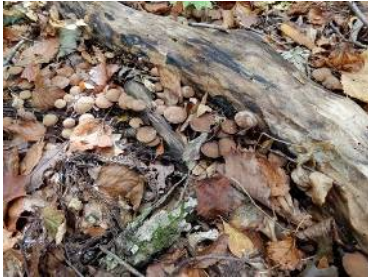
ムササビタケ (食不適)