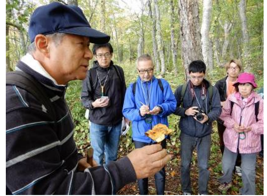
ヌメリスギタケモドキ?