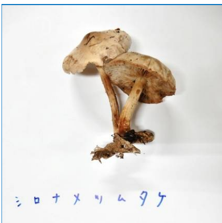
シロナメツムタケ