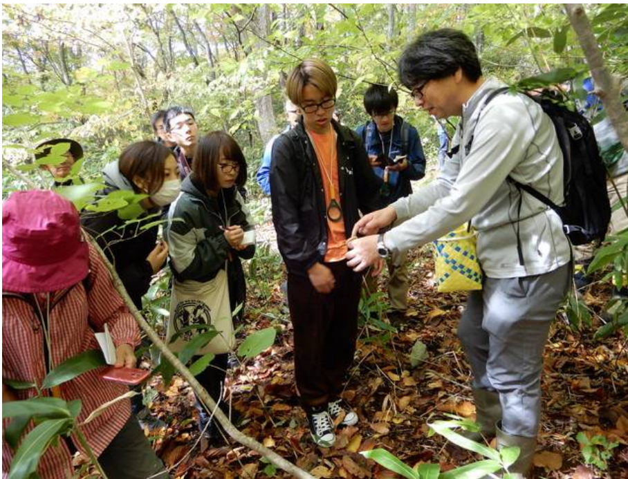
原講師の説明を熱心に聞く参加者たち