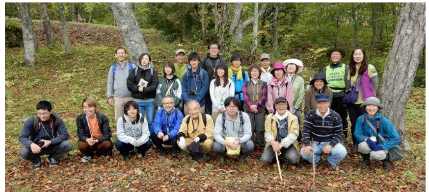
参加者全員で講師や助言者を囲み記念撮影