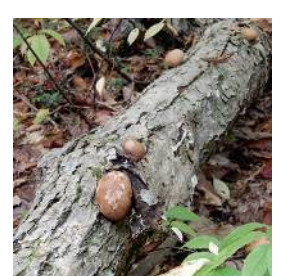
タヌキノチャブクロ (食可)