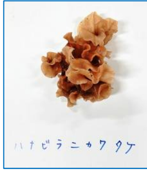
ハナビラニカワタケ