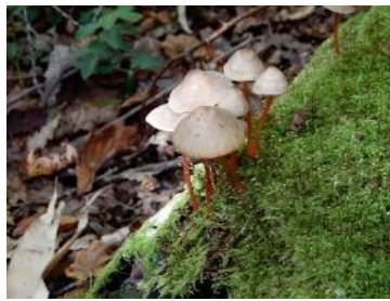
アカチシオタケ (食不適)