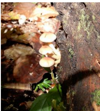
クリタケ (食可だが、要注意) 有毒成分もあるとの説あり