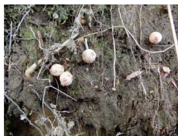
クチベニタケ (食不適)