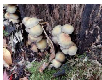
ニガクリタケ (猛毒)