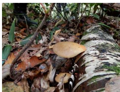
ムキダケ (食可) 有毒のツキヨタケに似るので要注意