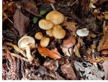
ツチスギタケモドキ (有毒)