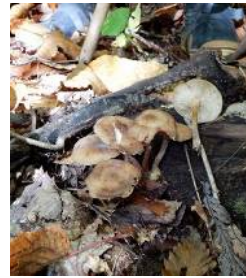
オニナラタケ (食可)