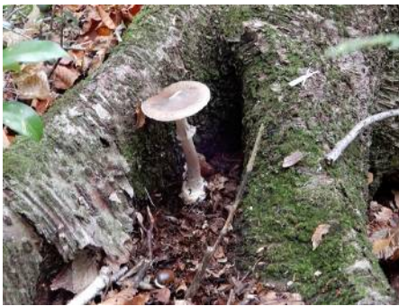
テングタケ (有毒) の仲間