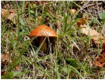
ハナイグチ (ラクヨウ) (食可)