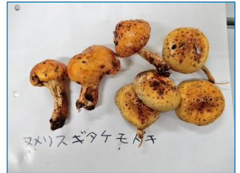
ヌメリスギタケモドキ