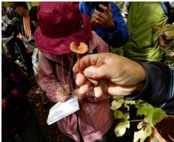
オオキツネタケ (食可)