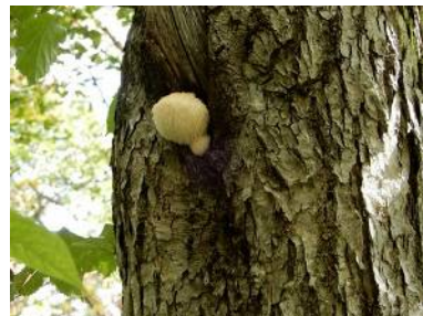
ヤマブシタケ (食可)