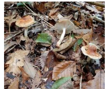
チャナメツムタケ (食可美味)