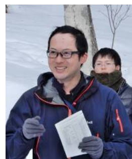
司会の広野解説員