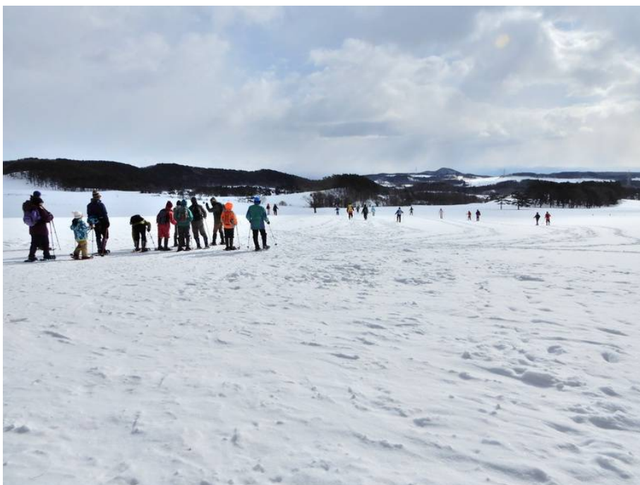
相の沢牧野の広大な雪原を行く