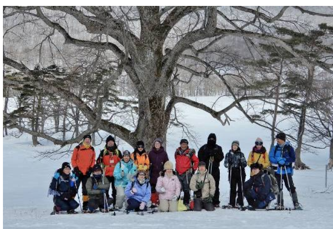
シナノキ大木の前で記念撮影 (1班)