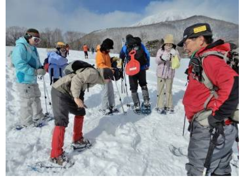
雪原に掘られた深い穴の観察。キツネがネズミを捕った？穴らしい