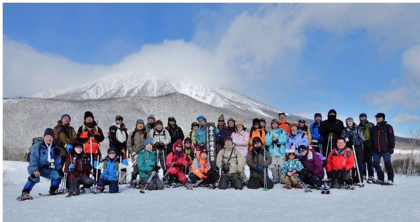
春子谷地展望台で岩手山を背景に 全員集合