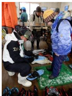
スノーシューの調整と装着手伝い