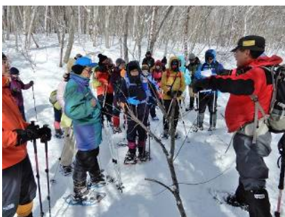
小枝についた繭の観察