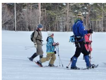
参加者最年少の子も元気にスタート