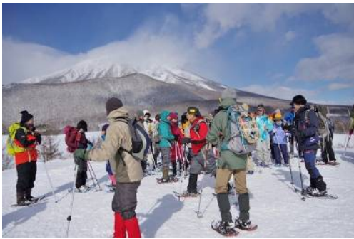
春子谷地展望台にて