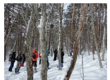
樹上に猛禽の巣か？ ノスリの巣かも