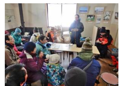
終了後、参加者の感想を聞く