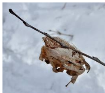
「クスサン」の繭 (ヤママユガ科)