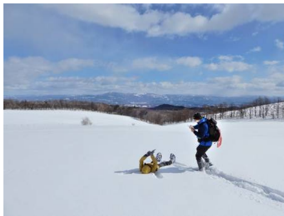
雪原で雪の感触を楽しむ「気持ちいい！」 奥の山並みに姫神山が見える