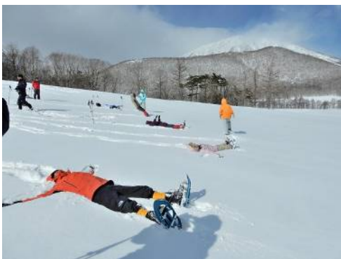
雪原にバタン。・・・「昔子供」