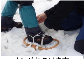
カンジキのはき方