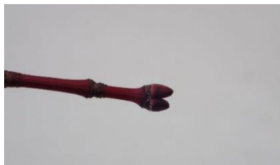
うちわ楓の芽(芽鱗など)