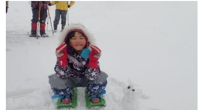
最後まで元気に行動します！