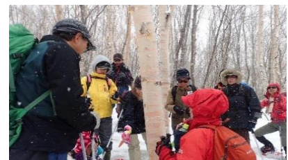
大堀様: ダケカンバ(草紙カンバ)