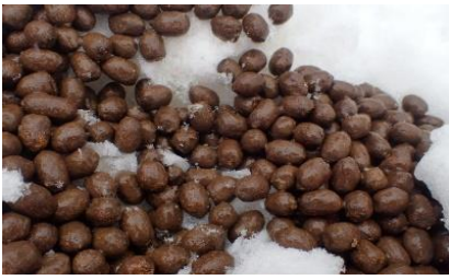
カモシカの...チョコボール？