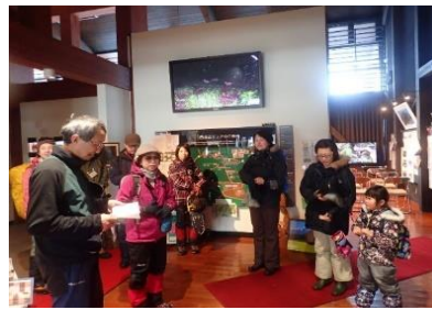
参加者の感想などひとこ