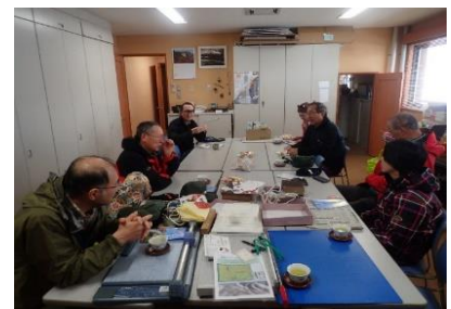
終了ミーティング