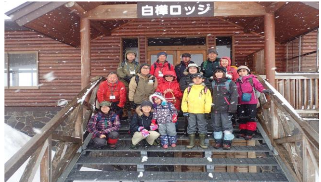
集合写真(撮影者チェンジ)