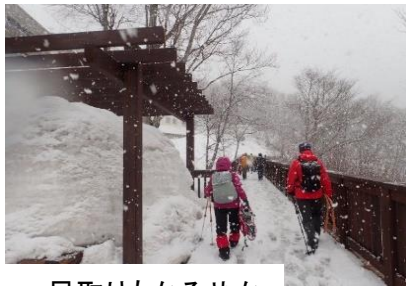
足取りもかるやか