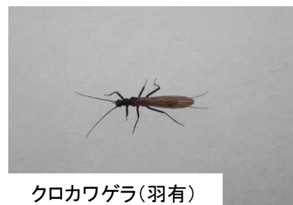
クロカワゲラ(羽有)