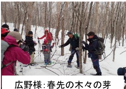
広野様: 春先の木々の芽