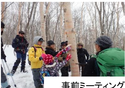
事前ミーティング