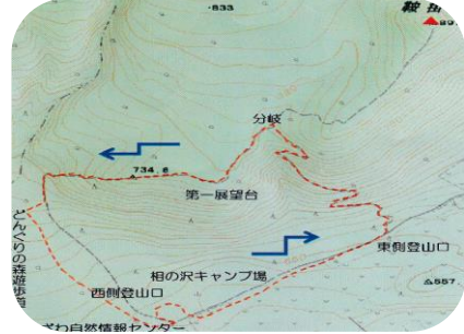
----- 今回の観察コース(約4.5km)