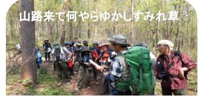
山路来て何やらゆかしすみれ草