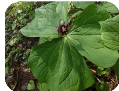
本日のゲスト:ヒダカエンレイソウ