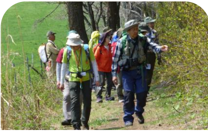
50分経過し、いよいよ東側登山口