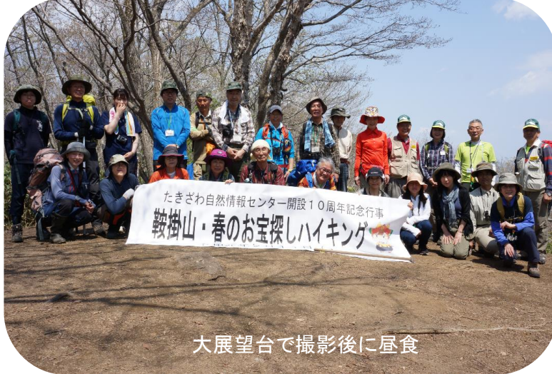
大展望台で撮影後に昼食