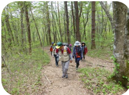
もうすぐ大展望台