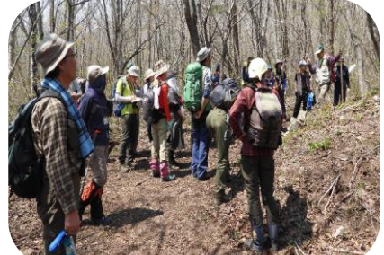
滝沢市山岳協会; 石組み炭焼き窯跡紹介