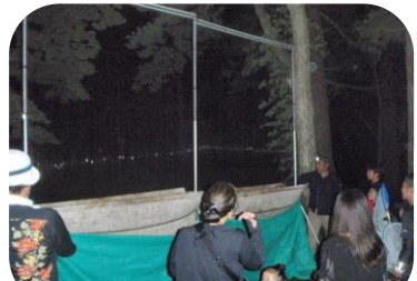
※ハープトラップの捕獲状況確認