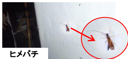
ヒメバチ VC前のライトトラップの状況

パイプの間にハープのような細い縦糸が沢山あるのに、(コウモリは通過できると思い)通過しようとするが、以外にも幅が狭くキャッチされ、下のポケットに落下し捕獲される。ポケット内は滑るので脱出は難しい。