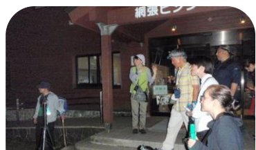
放す時の電波の発信状況確認