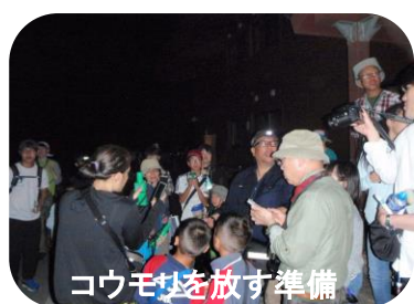
コウモリを放す準備