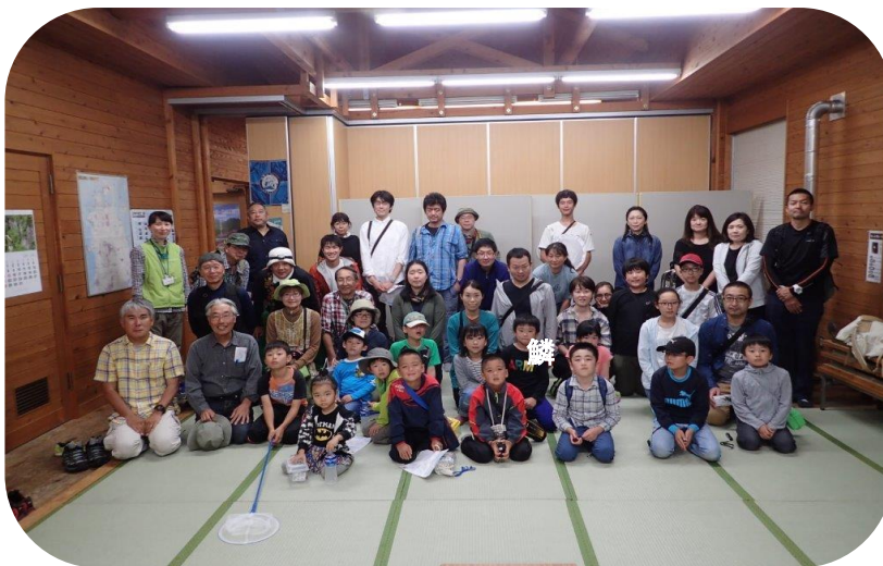
講演後に参加者の集合写真