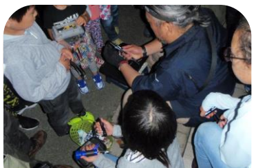
捕獲コウモリの検測