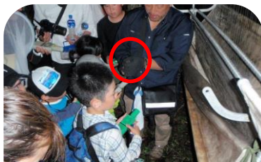
捕獲されたコウモリを参加者が確認 ※フジホウヒゲコウモリ

パイプの間にハープのような細い縦糸が沢山あるのに、(コウモリは通過できると思い)通過しようとするが、以外にも幅が狭くキャッチされ、下のポケットに落下し捕獲される。ポケット内は滑るので脱出は難しい。