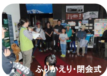
ふりかえり・閉会式