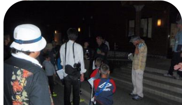
バッドディテクターでコウモリの発生電波状況を確認