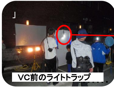
VC前のライトトラップ