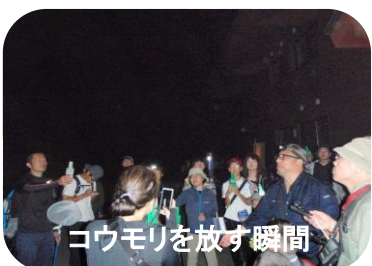
コウモリを放す瞬間