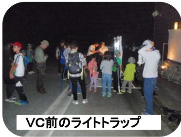
VC前のライトトラップ