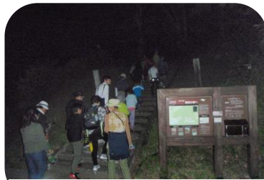
ハープトラップの確認に出発