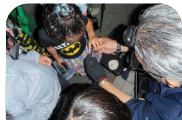
コウモリとの触れ合い