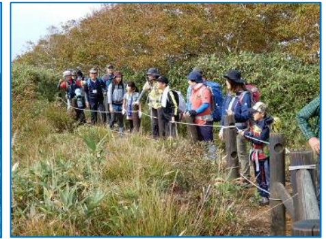
鎌倉森などの紅葉を眺める