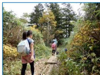
登山道脇にエゾオヤマリンドウ咲く