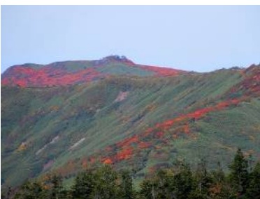
三ツ石山遠望（手前は大松倉山）