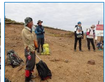
佐々木PVのハーモニカ演奏