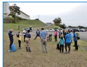
下山後、参加者全員から感想を伺う