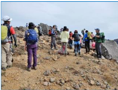
黒倉山に全員無事登頂