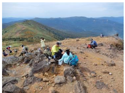
おもい思いの場所でお弁当を