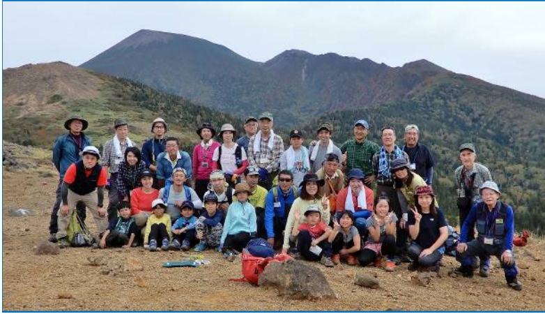
黒倉山と岩手山を背景に記念撮影（姥倉分岐にて）