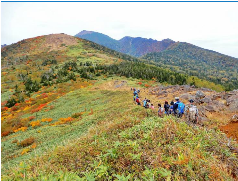
眼前に黒倉山、背後には鬼ヶ城から岩手山頂も