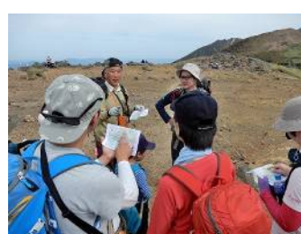
姥倉分岐で登山時注意事項説明