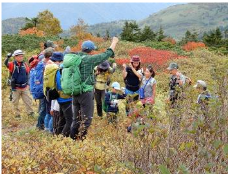
黒倉山裾で疲れが見える子供たちを励ます 「がんばるぞー!」、「オー!」?