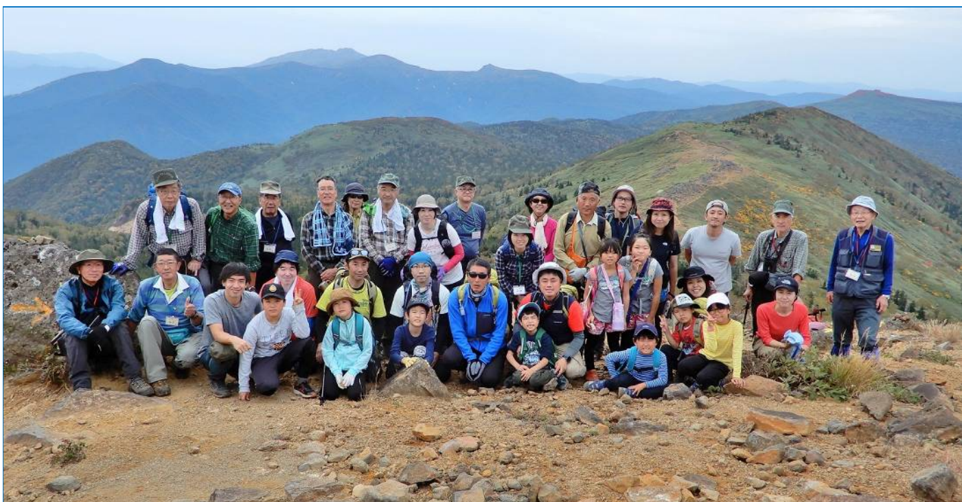
全員登頂！ 黒倉山頂上付近にて記念に （背景：最奥に秋田駒ヶ岳、右手奥に姥倉山と三ツ石山）