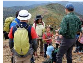
下山時の歩き方、注意点を説明（大堀リーダーと所講師）