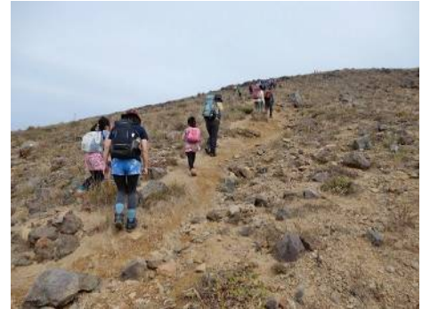
頂上はもう少しだ。がんばれ!