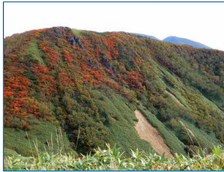
紅葉が美しい犬倉山上部