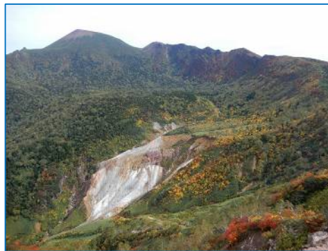
黒倉山頂上から大地獄谷と岩手山の眺め