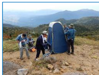
トイレテントの撤収作業