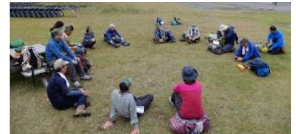
終了後のスタッフミーティング