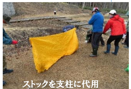
ストックを支柱に代用