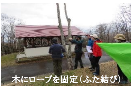
木にロープを固定(ふた結び)