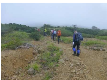
黒倉山麓