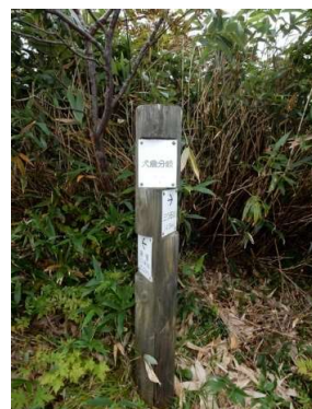
同左、誘導標「犬倉分岐」 「→三ツ石山4.5Km」 「←網張りリフト0.2Km」