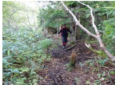
泥濘区間(木歩道欲しい)