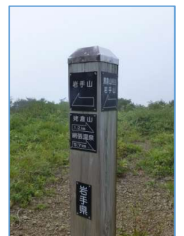
同左 「←岩手山」 「←黒倉山經由岩手山」 「→姥倉山1.2Km」 「→網張温泉5.7Km」