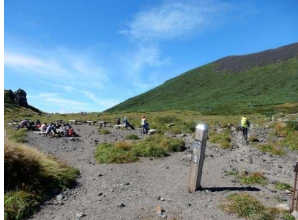
不動平誘導標 (別途9/3撮影分) 「←御花畑1.9Km」 「→八合目避難小屋0.6Km」