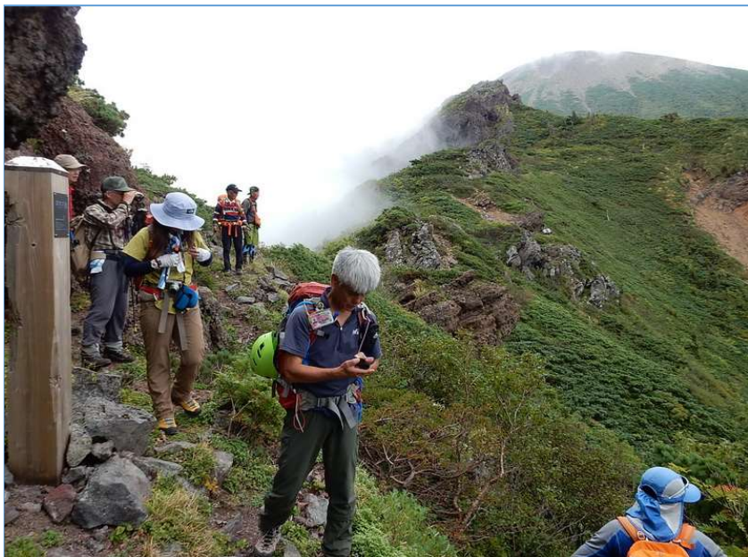
屏風尾根からお花畑へ向かう(皿峰直下にて)