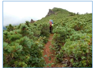
ハイマツ原をⅡ峰に向かう