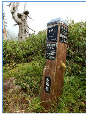
同左、誘導標 「→岩手山」、「←黒倉山經由姥倉山 1.9m」 「網張温泉6.4Km」 「←姥倉山1.8Km」、「←網張温泉6.3Km」