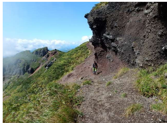
要注意箇所(人物付近沢側は草木なく谷に転落危険性) 岩に固定ロープ等あれば安心だが・・・