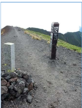
焼走り上坊コース 下山口誘導標