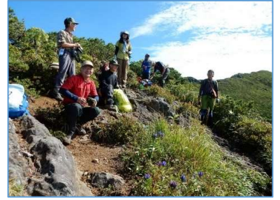
標高約1650m 地点で小休憩