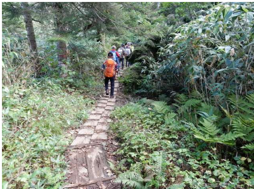
犬倉山北側分岐～水場間の木歩道