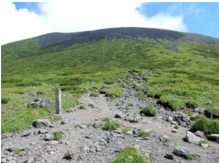
不動平分岐誘導標 (別途7/22撮影分) 「→岩手山 1.2Km」 「←御神坂」、「←鬼ヶ城」 「→八合目、馬返し」