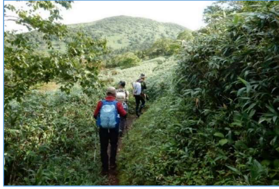
犬倉山北西山腹トラバース 正面に姥倉山