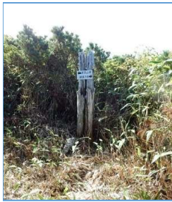
古い標柱(標高約1600m) 「←岩手山頂」「→網張方面」