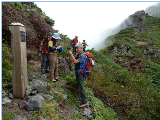
Ⅲ峰直下に誘導標あり(H1700m 付近) 「→平笠不動 0.8Km」 「←お花畑 2.1Km」 屏風尾根からお花畑への下降点