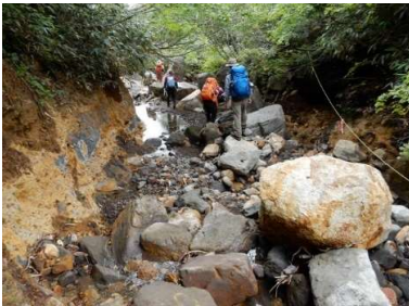
湧水付近(右岸の岩から湧出)