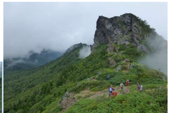
Ⅲ峰に向かう