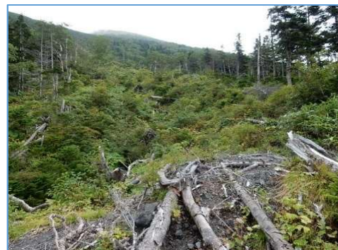
倒木地区 (H1600m 付近)