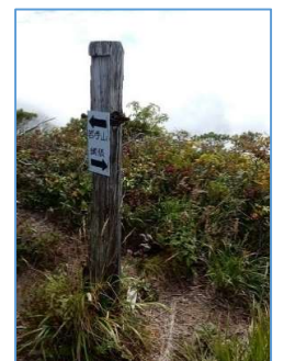
同左、標柱 「←岩手山」 「→網張」