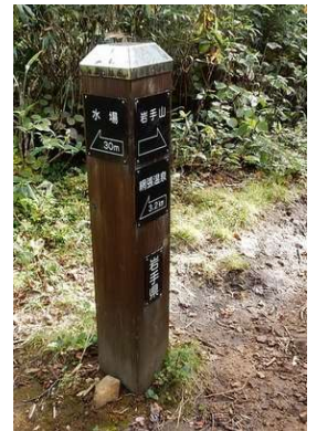
水場付近誘導標 「←水場30m」、「→岩手山」 「←網張温泉3.2Km」