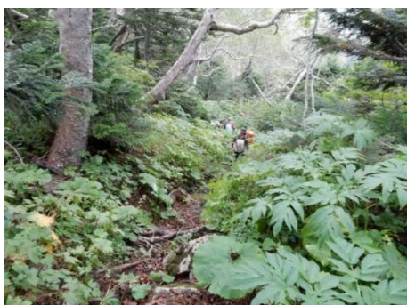
屏風尾根からの下り (H1650m 付近)