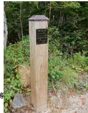
御釜湖脇の誘導標 「→御釜湖」 「←御苗代湖」