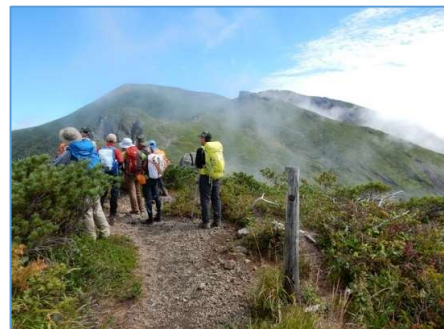
「源次郎」南西ピーク (H1730m 付近)