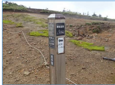
姥倉分岐誘導標 「←姥倉山0.5km」 「←松川温泉」 「→岩手山」 「←網張温泉5.0km」 「←網張 三ツ石山」