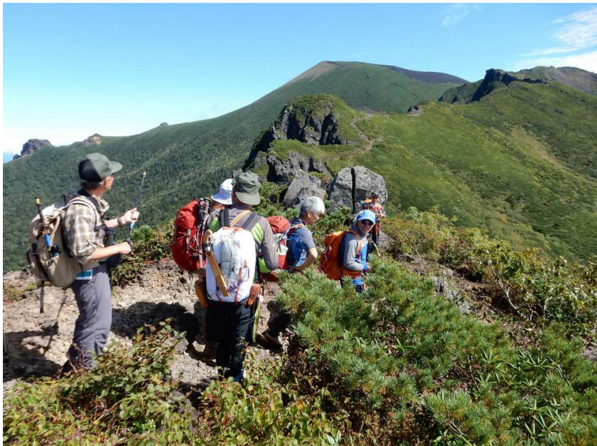
初秋の鬼ヶ城を登る