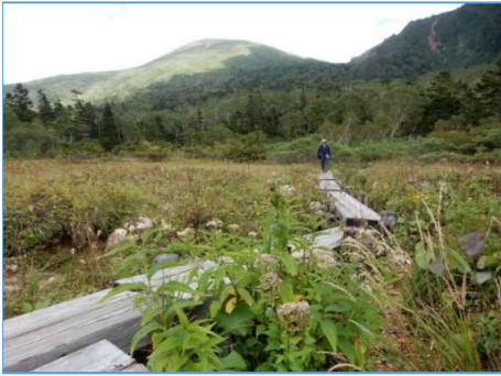
お花畑分岐から山頂方向