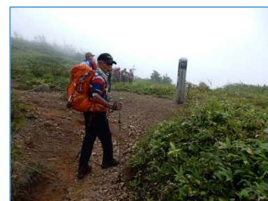
黒倉下分岐誘導標