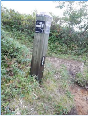
犬倉山直下(西側)の誘導標 「→三ツ石山、網張温泉」 「←岩手山」(いずれも距離表示なし)