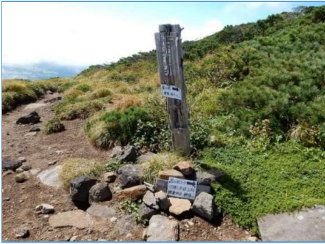
鬼ヶ城分岐の標識 木板「←御神坂駐車場」 白板「→鬼ヶ城、網張・松川へ」 根元白板「鬼ヶ城コース」 「切通し分岐3.4Km」 「姥倉分岐、網張へ」