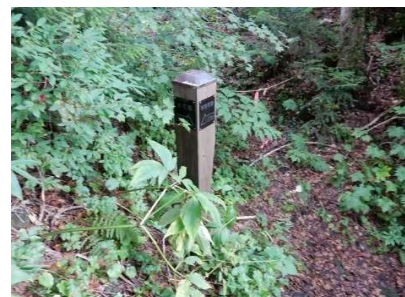
誘導標 「→お花畑1.0Km」 「←平笠不動1.5Km」