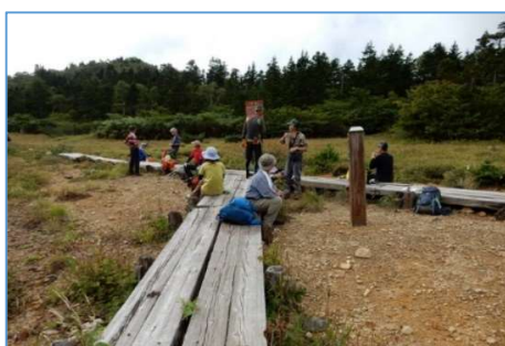
御花畑分岐で休憩