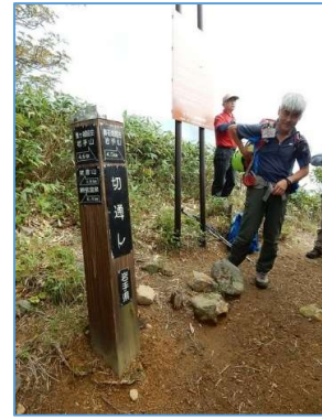
切通し誘導標 「→鬼ヶ城經由岩手山4.6Km」 「←姥倉山1.9m」、「←網張温泉6.4Km」 「→御花畑經由岩手山4.5Km」