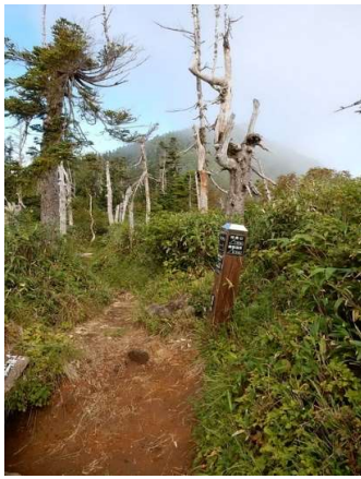
黒倉山分岐(南東側)