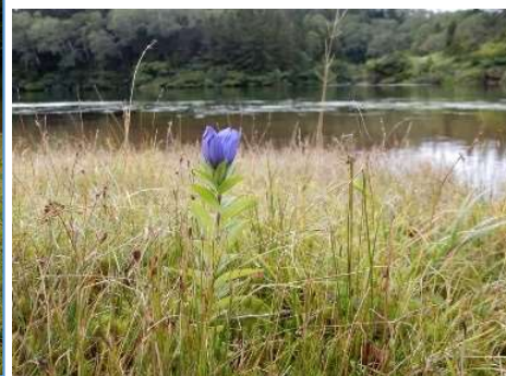
湖畔に咲くエゾオヤマリンドウ