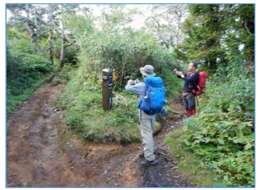
犬倉山直下(北側)の誘導標 「↑犬倉山經由網張温泉」、「←岩手山」 「→網張温泉3.0Km」