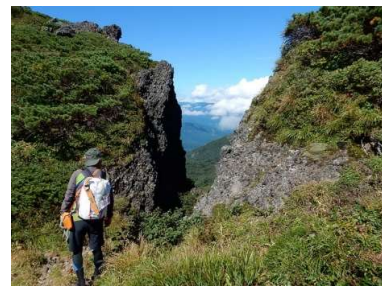
通称「窓」、「Cルンゼ」(H1750m 付近)