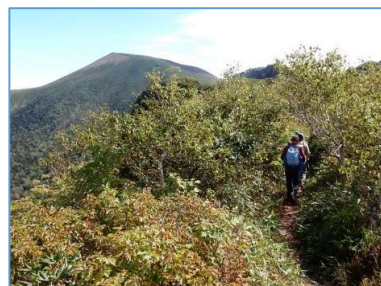
正面に岩手山頂(H1640m 付近)