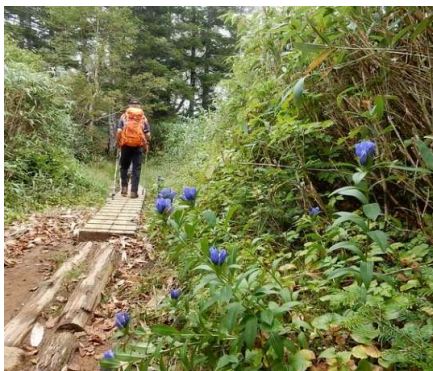
エゾオヤマリンドウ 咲く