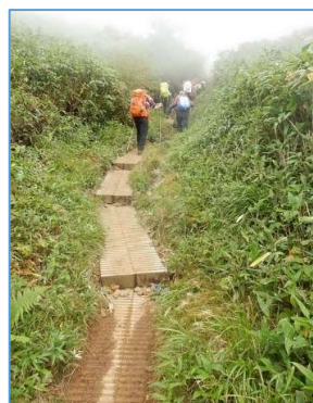
姥倉山麓の木歩道