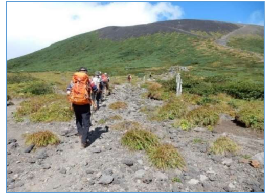
不動平から山頂お鉢へ向かう