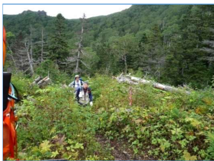
倒木地区を進む