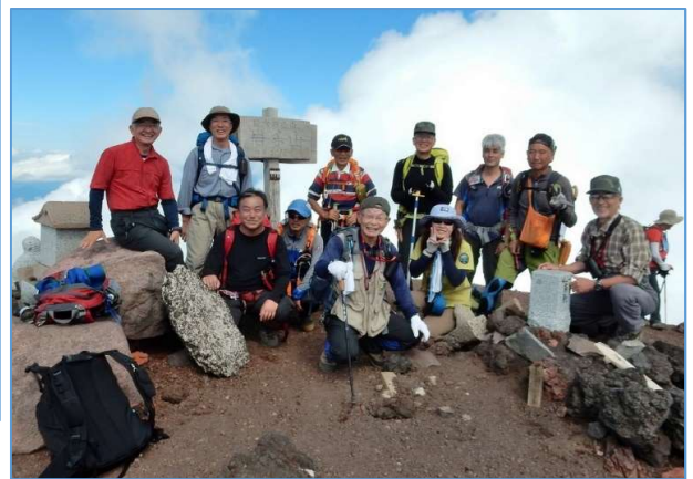
参加者一同、岩手山頂にて