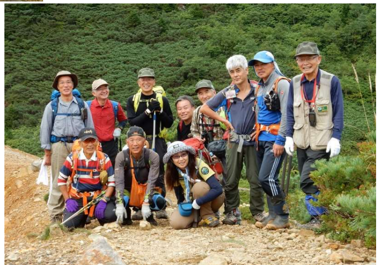
大地獄谷分岐にて参加者一同