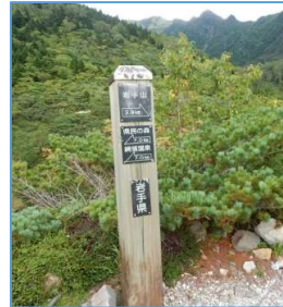
大地獄分岐よりお花畑側 約200m地点の誘導標 「→岩手山3.9Km」 「←県民の森7.0Km」 「網張温泉7.0Km」