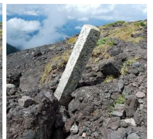
八合五夕目石標 文政五年の刻みあり