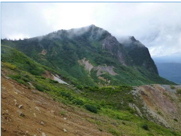
大地獄谷から望む黒倉山