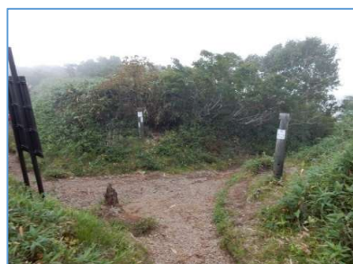
三ツ石山への分岐点