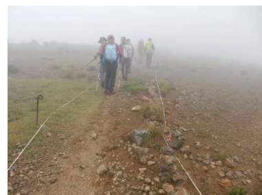
ロープで登山道表示(姥倉尾根)