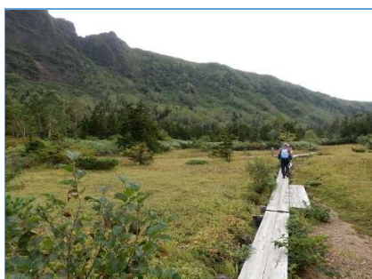
御花畑分岐に向かう