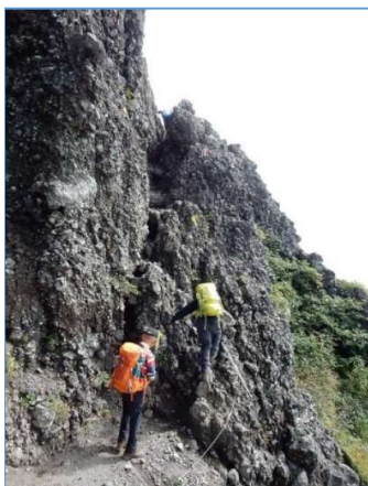
狭い割目を登る(H1830m 付近)