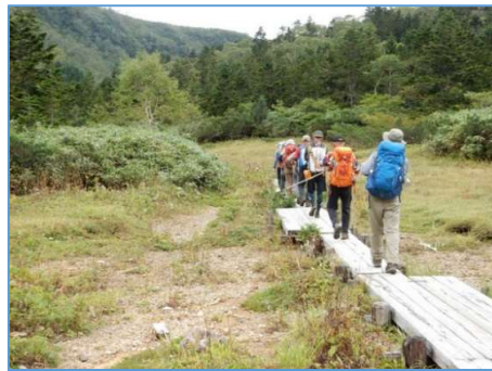
お花畑分岐を後にして大地獄谷分岐に向かう