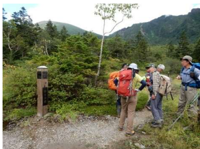
御釜湖前分岐誘導標 「←平笠不動2.3Km」、「→お花畑0.2Km」、「←御釜湖」 同左対面の誘導標(右奥が御釜湖等) 「↑御釜湖、御苗代湖」 (側面)「この先行きどまり」