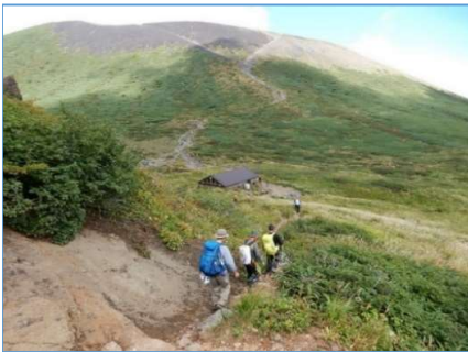
鬼ヶ城分岐から不動平小屋へ