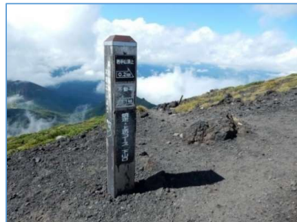
焼走り上坊コース下山口誘導標 「→岩手山頂上0.2Km」 「←不動平 1.1Km」 (右側面)「右下:平笠不動0.8Km」 (左側面)「左下:焼走り・上坊」