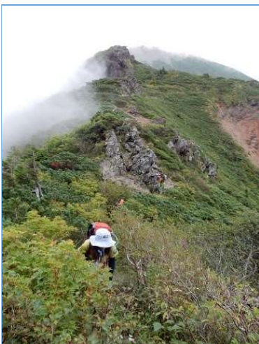
Ⅲ峰付近からⅡ峰、Ⅰ峰方向