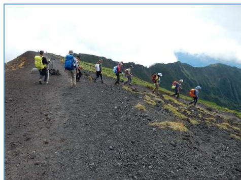
平笠不動への降り口