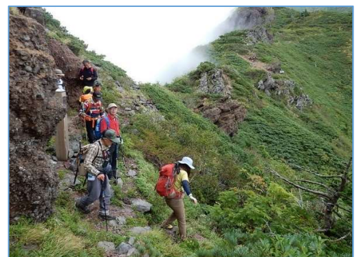
お花畑へ下降開始