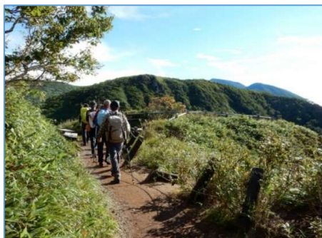
犬倉展望台付近に行く