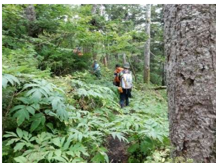
倒木地からお花畑方面へ