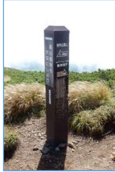
鬼ヶ城分岐誘導標 「←岩手山頂上1.4Km」 「→御神坂P 5Km」