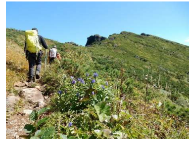
エゾオヤマリンドウ咲く尾根道