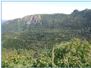
赤倉岳と御苗代湖眺望(H1640m付近から)