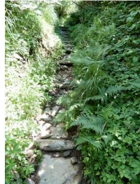
木階段石張歩道 (標高約1,320m)