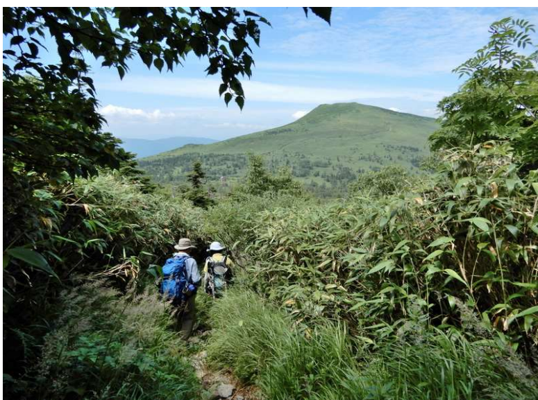
大松倉山頂稜線から三ツ石湿原に向かう (正面に三ツ石山と三ツ石山荘)