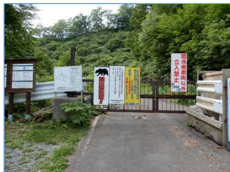
奥産道大松倉ゲート (看板等が林立状態)