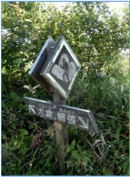
前同、(右側) 「←犬倉 網張→」