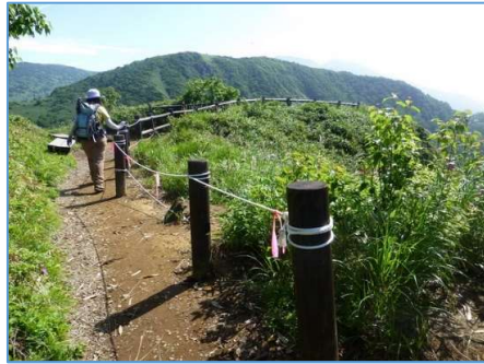
網張元湯展望台付近 (展望台突端から元湯が見えない)