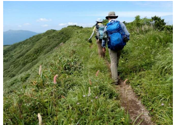
大松倉山頂稜線を行く(左側は下の眺め) (正面左手奥は乳頭山)