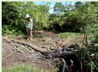
犬倉分岐から約1.09km付近