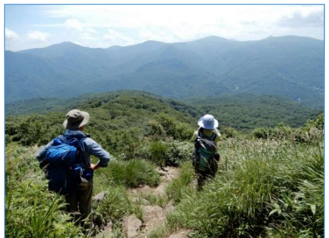
展望台にて葛根田ブナ原生林を眺める