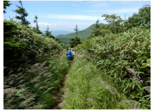
同左標柱近く (標高約1,400m付近) (登山道は草に覆われている)