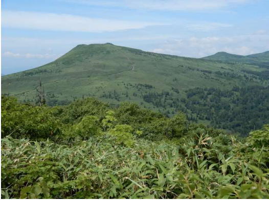
大松倉山頂稜線から望む三ツ石山ほか