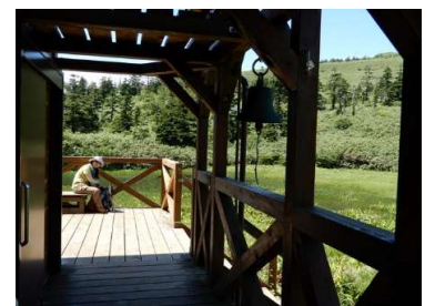
三ツ石山荘のテラス