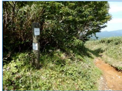
犬倉分岐の標柱 (2本あり) 「犬倉分岐」 「←網張 (リフト乗場0.2km)」