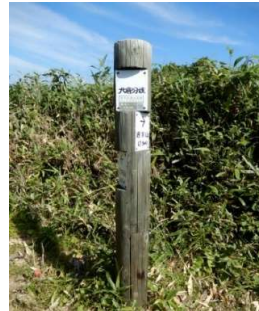
「犬倉分岐」 「←三ツ石山 (4.5km)」 「岩手山 (7.9km)→」