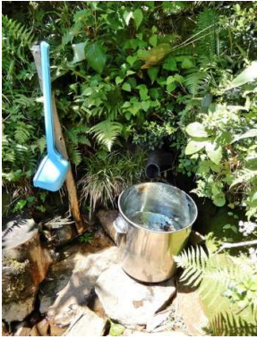
水場は潤れ始めていた (滴が落ちる程度)