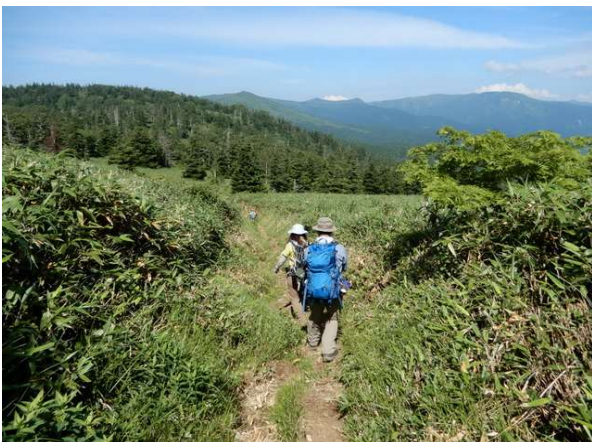
犬倉分岐から大松倉山に向かう 正面奥に大松倉山、「規標ノ台 (三角点)」、小畚山、 大深岳～源太ヶ岳、畚岳などの裏岩手縦走路が続く