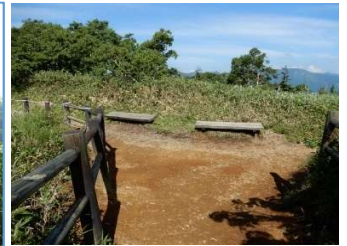
同左展望台の木製ベンチ2基