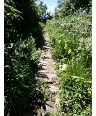
三ツ石湿原付近木道 (標高約1,290m)