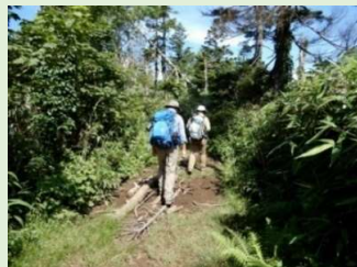
犬倉分岐から約0.33km付近