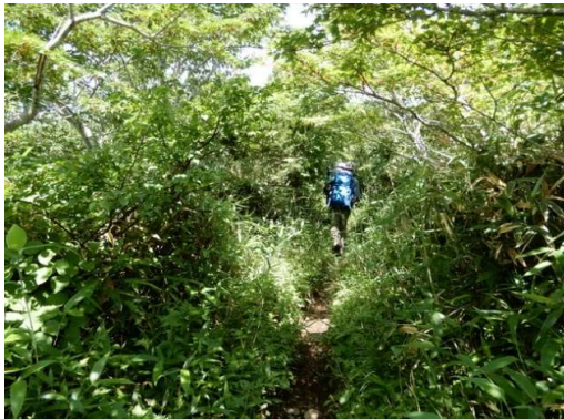
大松倉山頂から0.5km付近、草木が道を覆う