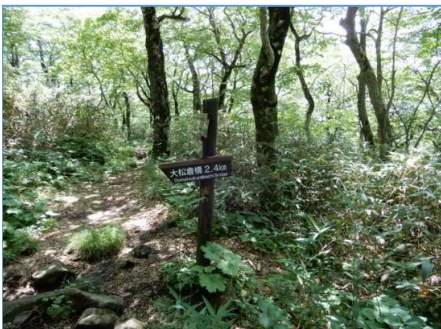
連絡道分岐の誘導標 「←大松倉橋2.4km」