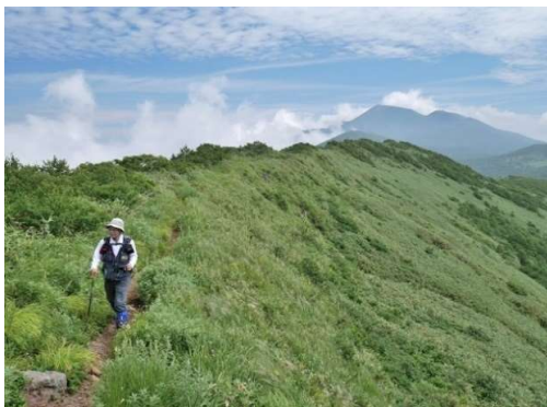
大松倉山頂稜線(背後に岩手山)