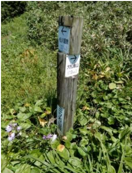
松川分岐の標柱 (岩手県) 「三ツ石山荘」 「←松川温泉(3.7km)」 「大松倉山1.3km→」