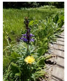
サワギキョウとミズギク?