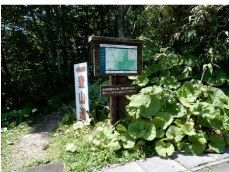
連絡道入口 立看板と国立公園案内図がある