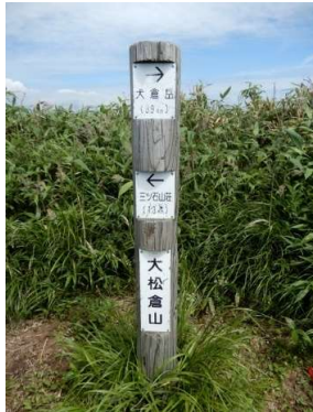
標柱(岩手県)「大松倉山」 「犬倉岳(3.9km)→」 「←三ツ石山荘(1.3km)」 ↑ 正しくは「犬倉山」