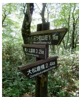
「三ツ石山荘1.1km→」 「←滝ノ上温泉3.2km」