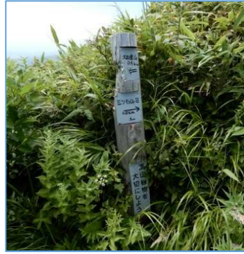
三ツ石湿原への下降点標柱 「←大松倉山0.4km」 「三ツ石山荘0.8km→」