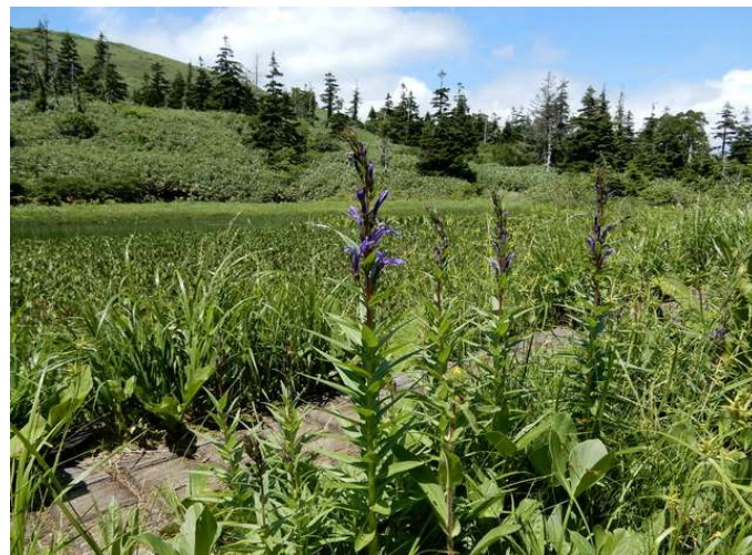
湿原にサワギキョウが咲き始めた