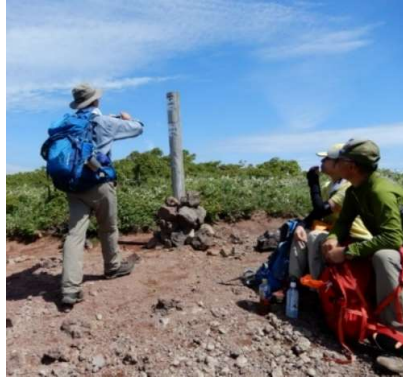
標高約1,320m付近の標柱(岩手県) 「←大松倉山1.1km」、「犬倉岳2.8km→」 ↑ 距離表示間違い、実際は0.6km