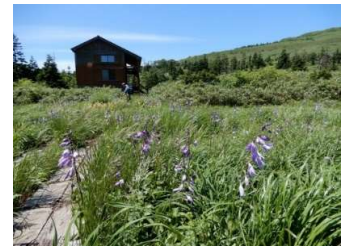
タチギボウシ鮮やか