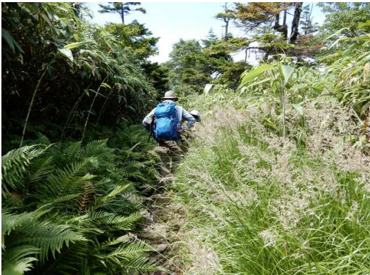
足元が草で隠される (標高約1,350m付近)