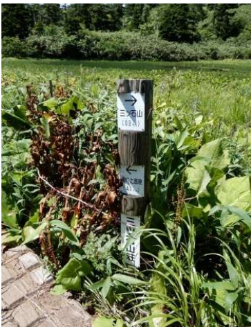
山荘脇の標柱 (岩手県) 「三ツ石山荘」 「三ツ石山0.9km→」