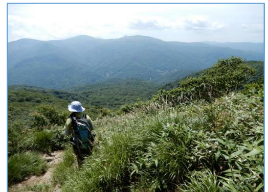
展望台、眼下に葛根田ブナ原生林が広がる