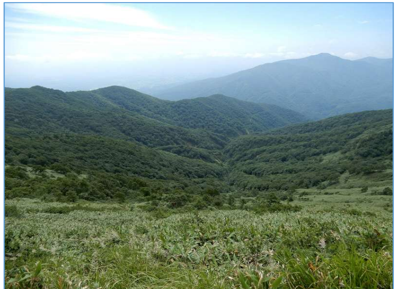
大松倉山頂稜線から大松倉沢を俯瞰(奥産道の一部も見える) (右上の山並みは高倉山と懐に抱かれるような小高倉山)