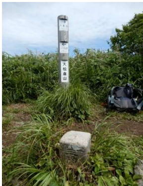
大松倉山頂上 二等三角点がある (標高1,408m)