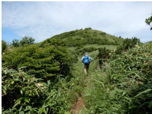
大松倉山頂手前150m付近