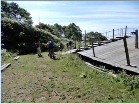
網張リフト終点 (標高約1,325m)