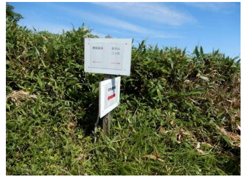
階段を登り切った所の案内板 (左側) 「←網張温泉」「岩手山・三ツ石→」 「←リフト乗場」