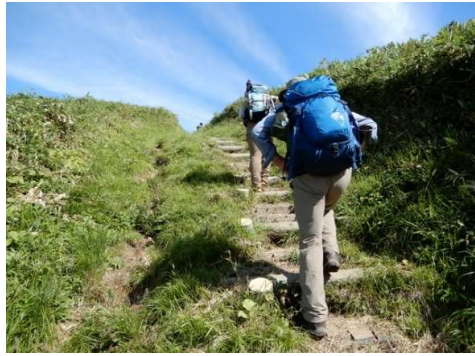
擬木階段 (78段) に早速息切れ