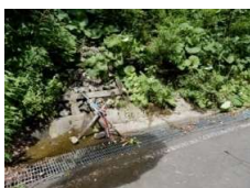
奥産道の水場 (飲用適否不明)

ゲート前駐車場にトイレの設置が望まれる。 (三ツ石山荘トイレ負荷軽減のためにも必要)