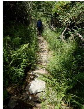
木枠石張歩道 (標高約1,345m)