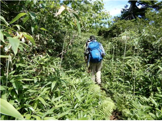
大松倉山南東山麓、登山道が笹や草に覆われる