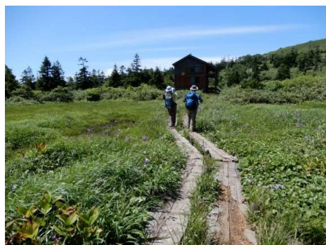
三ツ石湿原と三ツ石山荘