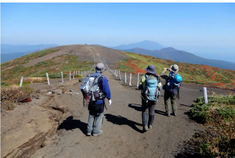
(写真No.41) 焼森のなだらかな稜線を行く 正面の丸い丘が焼森。奥に岩手山と高倉山など