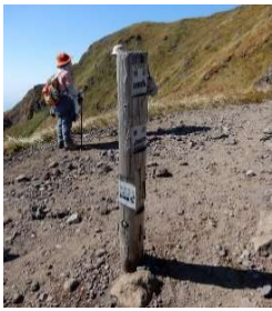
(No.24) 標柱「←男岳0.3km」 「横岳0.7km→」 「↑阿弥陀池0.1km」