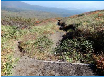
(No.45) 土止め階段 (4段、W=3~1.2m)