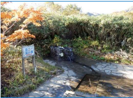
休憩所前の水場 「足洗い場」の表示