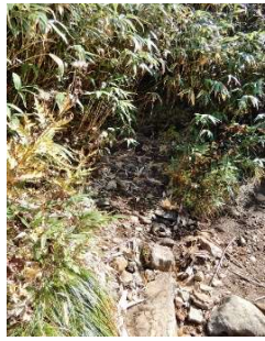
(No.49) 水場 (取水不可)