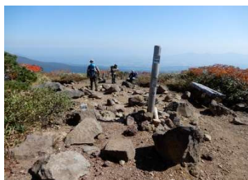
横岳山頂 標柱「横岳」「男岳1.0km」「焼岳0.6km」 「国見温泉4.5km」