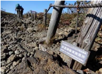
(No.8) PV 活動標示板 「H25 ボランティアファンド助成事業」