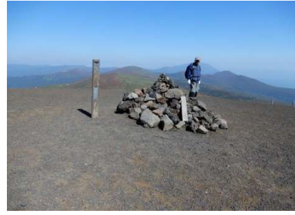
焼森山頂 標柱「焼森山頂」「秋田県」 「Mt. Yakemori 焼森1551m」