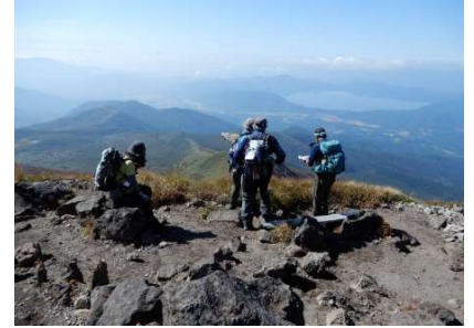
男岳山頂から田沢湖俯瞰