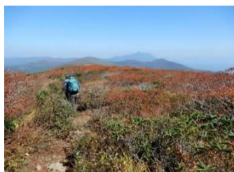
(No.39) 眺望の効く快適な尾根道