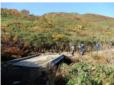
(No.2) コンクリート橋 L=6m W=4m