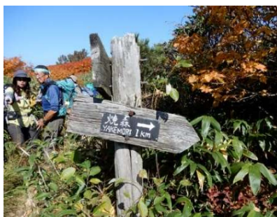
(No.51) 標識「焼森Yakemori 1km→」「←湯森山Yumori 1.3km」