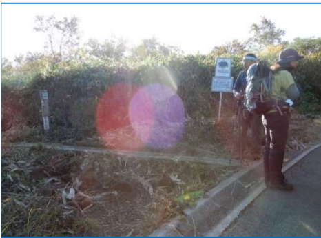
焼森への分岐 標柱「駒ヶ岳八合目」 「↑阿弥陀池2.4km」「←焼森1.2km」