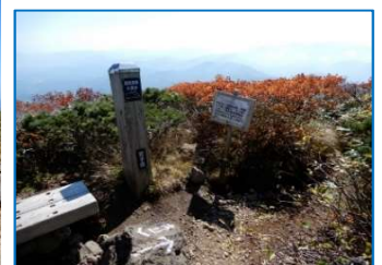
標柱「国見温泉、大焼砂→」 「岩手県」