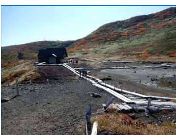
(No.20) 男女岳下分岐から 阿弥陀池小屋方向