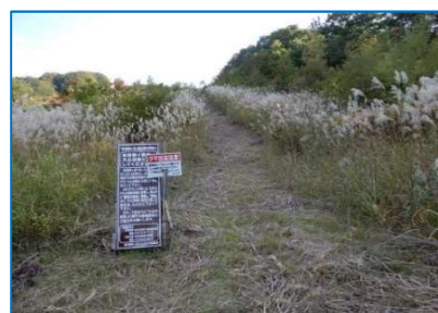
(No.77) 標柱「笹森コース登山口 (乳頭温泉口)」 「笹森山4.0km」