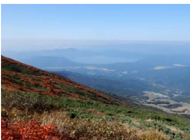
(No.11) 第四展望台から田沢湖俯瞰