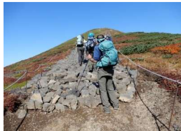
(No.16) 男女岳登坂路石張始点