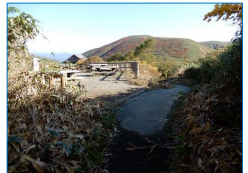
(写真No.1) 登山口近くの木ベンチ(5基)