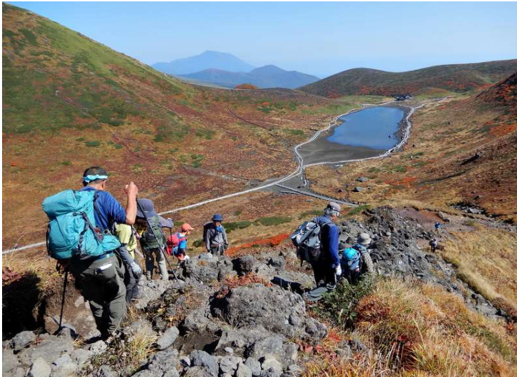
男岳山頂から「馬の背」、横岳に向かう 正面に阿弥陀池と岩手山