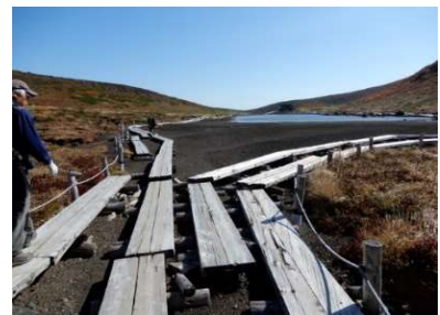
(No.14) 阿弥陀池周回木道分岐