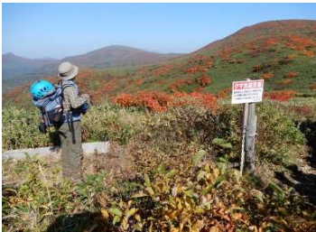
笹森山下分岐 標柱「笹森山」 「↑湯森山1.0km」 「↓駒ヶ岳八合目」 「←国民休暇村4.5km」