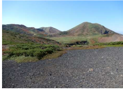
(No.43) 振り返ると男女岳が大きく 左側奥に男岳