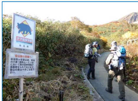
同左場所のクマ出没注意看板