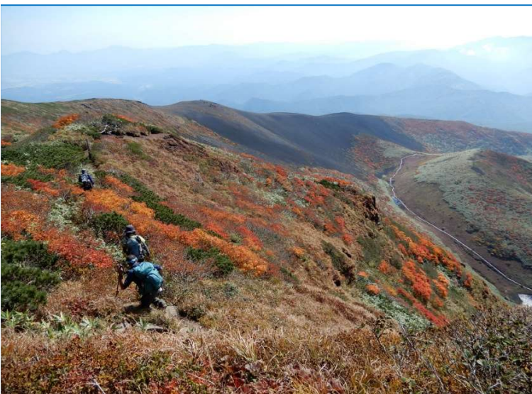
(写真No.36) 「馬の背」を越えて横岳に向かう 横岳からの稜線に大焼砂と右手に小岳