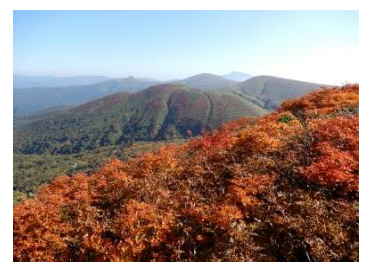
同左位置からの眺望 笹森山、乳頭山から笹森山、岩手山