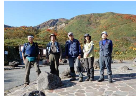
「元気なうちに」1枚、パチリ