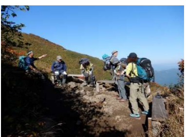
(No.5) 第一展望台 (木ベンチ3基)