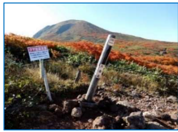
標柱「片倉岳」「秋田県」「片倉岳展望台(赤土の広場)」 看板「熊出没注意」背後は男女岳、(木ベンチ5基)