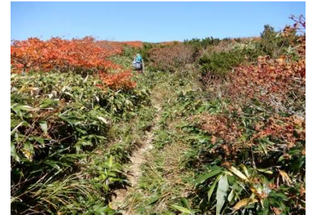
(No.55) 湯森山頂手前約200m付近