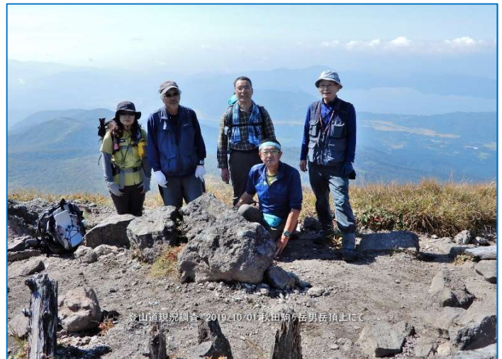
男岳山頂にて、踏査参加者