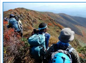
(No.35) 「馬の背」から小岳俯瞰