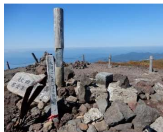
標柱「男女岳(女目岳) 1,637m」