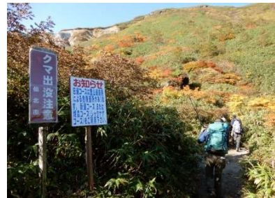
(No.4) 旧道分岐、熊出没注意と旧道崩落による危険箇所ありの表示