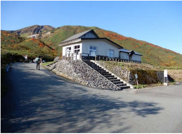
八合目休憩所、奥に男女岳と片倉岳