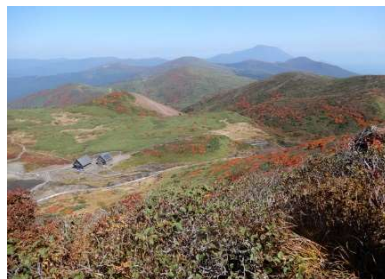
(No.34) 阿弥陀池小屋俯瞰