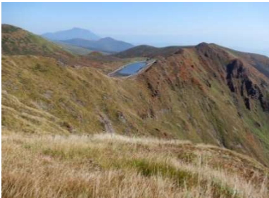
(No.29) 男岳山頂からの眺め 岩手山と阿弥陀池など