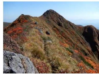
(No.31) 「馬の背」の峻険な尾根