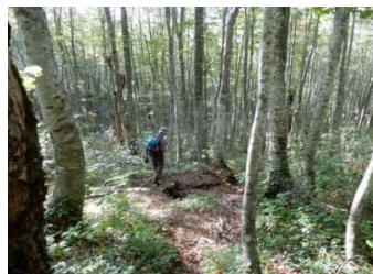
(No.74) 小径木ブナ林も美しい