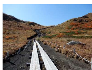
(No.22) 男岳分岐から男岳への木道