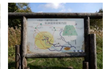
(No.78) 乳頭温泉案内図 (環境省) 駐車場脇に設置されている