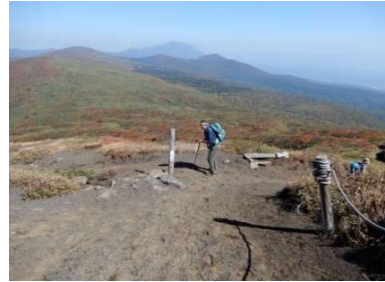
(No.44) 標柱「Mt. Yakemori焼森分岐」 「←八合目1.2km」「湯森山2.5km→」