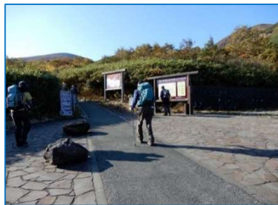
登山口の案内板等 火山活動注意看板もあり