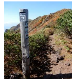
(No.36) 標柱「阿弥陀池小屋0.3km」 「男岳0.8km」 「横岳0.2km」