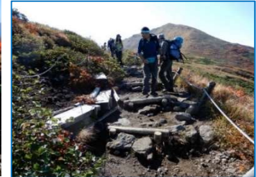
(No.10) 第四展望台 (木ベンチ (3+7) 基)